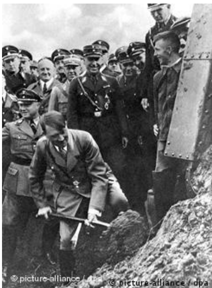
Slika 1 Hitlerova uloga u izgradnji autocesta

Adolf Hitler započeo rad na dijelu ceste u pažljivo odabranom propagandnom kadru