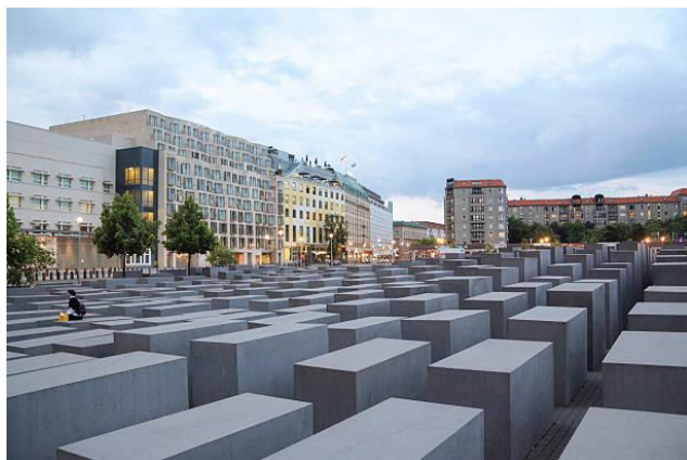
Slika 4 Memorijal ubijenim Židovima Europe

Izgrađen 2005. godine prema projektu arhitekta Pietera Eisenmana. Memorijal se nalazi u samom centru Berlina, ( https://www.gettyimages.com/photos/holocaust-memorial-berlin )