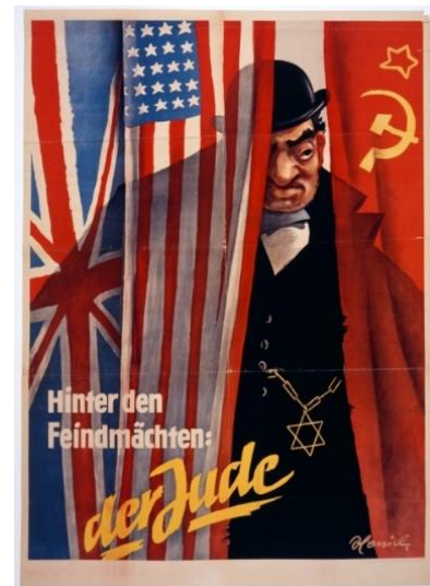
Slika 5 "Iza neprijateljskih sila: Židov." 1942.

Često su prikazivali Židove kao uključene u zavjeru za izazivanje rata. Ovdje se stereotipni Židov urotio iza kulisa kako bi kontrolirao savezničke sile, (izvor: https://encyclopedia.ushmm.org/content/en/photo/nazi-anti-jewish-propaganda )