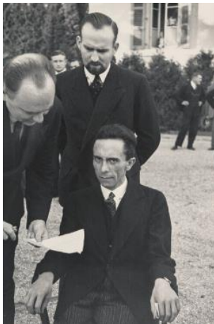
Slika 2 Joseph Goebbels, Geneva, 1933.

Snimljen u hotelu Carlton u Ženevi tijekom konferencije Lige naroda 1933. godine, ovaj zloslutni portret ostaje jedna od najpoznatijih Goebbelsovih slika. Akreditirani novinar, Eisenstaedt je bio na rutinskom zadatku koji je pokrivaio konferenciju, iako je za razliku od drugih dopisnika bio Židov, što nije prošlo nezapaženo od strane ministra propagande Trećeg Reicha, (izvor: https://www.artsy.net/artwork/alfred-eisenstaedt-joseph-goebbels-geneva )