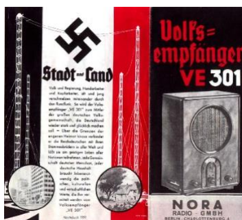
Slika 3 model VE 301

Brošura o modelu radija VE301 sa kratkim propagandnim tekstom i prikazom nacističkih simbola, (izvor: https://antiqueradio.org/art/VolksempfaengerBrochure01.jpg )