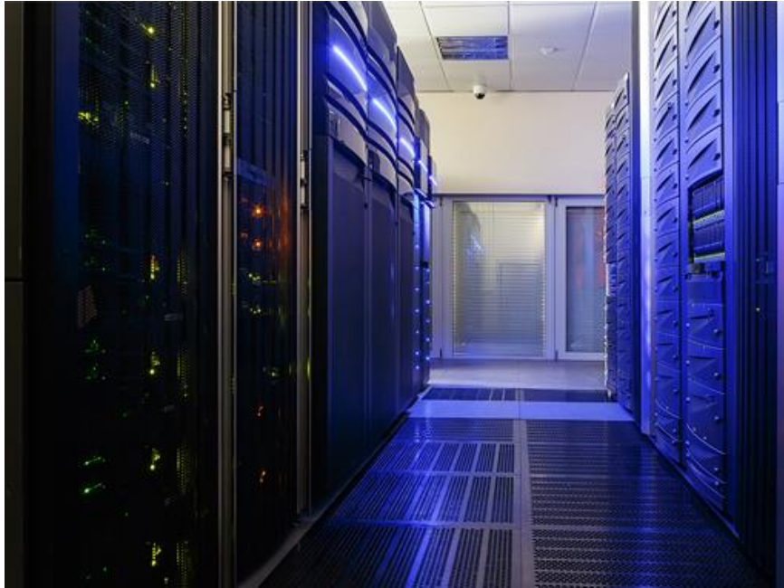
Slika 4. Klimatizirana prostorija sa serverima