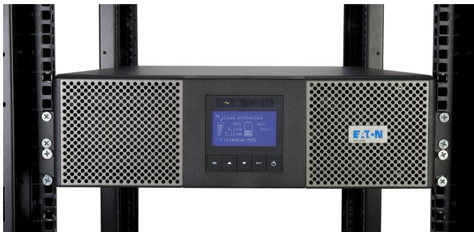
Slika 5. UPS