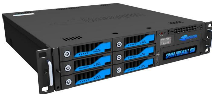
Slika 7. Hardverski vatrozid

Firewall ujedno predstavlja idealno rješenje za kreiranje Virtualne Privatne mreže (VPN) jer stvarajući virtualni tunel kroz koji putuju kriptirani podaci (omogućuje sigurnu razmjenu osjetljivih podataka među dislociranim korisnici). Firewall je servis koji se tipično sastoji od firewall uređaja i Policy-a (pravilnika o zaštiti), koji omogućuje korisniku filtriranje određenih tipova mrežnog prometa sa ciljem povećanja sigurnosti i pruža određeni nivo zaštite od provale.