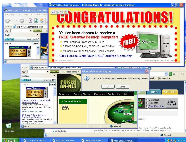
Slika 8. Ogllašivački software

Ogllašivački softver (engleski naziv adware - advertising-supported software) prikazuje korisniku oglase čak i kad trenutno nije spojen na Internet (drugim riječima, nije online), a može se instalirati zajedno s određenim aplikacijama 23 (npr. s Kaaza peer-2-peer programom). Narušava privatnost korisnika, poput špijunskog softvera. Neki od poznatijih primjera oglašivačkog softvera su Zwinky, ErrorSafe, Gator i BonziBUDDY.