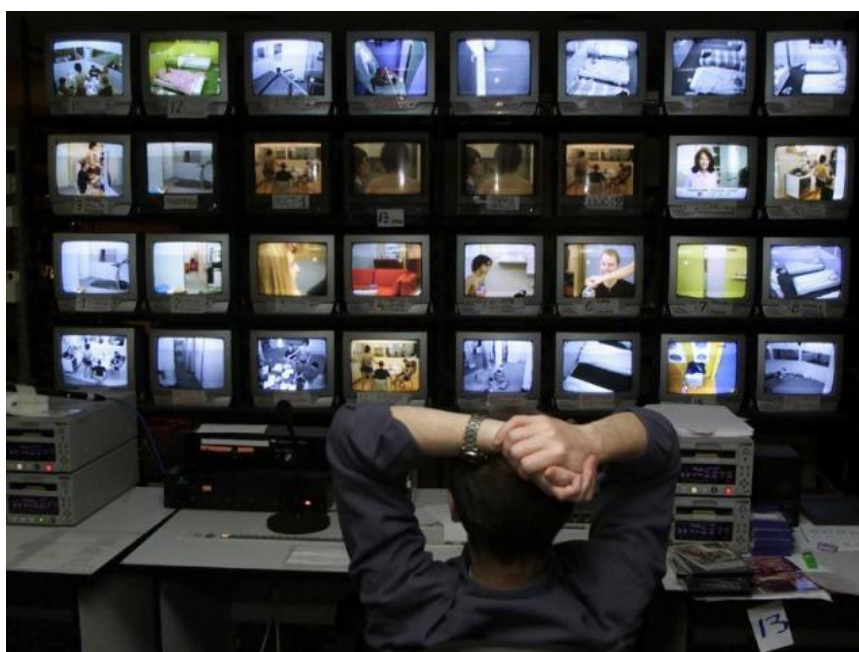
Slika 1. Video nadzor

instalirana oprema za nadzor. Obično se pri planiranju postavlja jedan takozvani sigurnosni centar gdje su smješteni monitori (u zadnje vrijeme samo jedan ) na kojima se prikazuje slika koju snima kamera u sustavu video nadzora. Prednosti ovog sustava su cijena, koja svakim danom sve više pada, fleksibilnost, jednostavno proširenje sustava kao i to što tehnologija video nadzora predstavlja tehnologiju budućnosti. Kraće vrijeme instalacije i mogućnost instalacije kamera za nadzor na praktično svako mjesto doprinjelo popularizaciju ovog sustava zaštite.