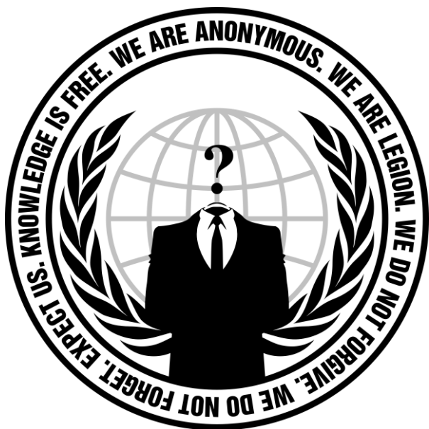
Slika 10. Logo hakerske skupine Anonymous