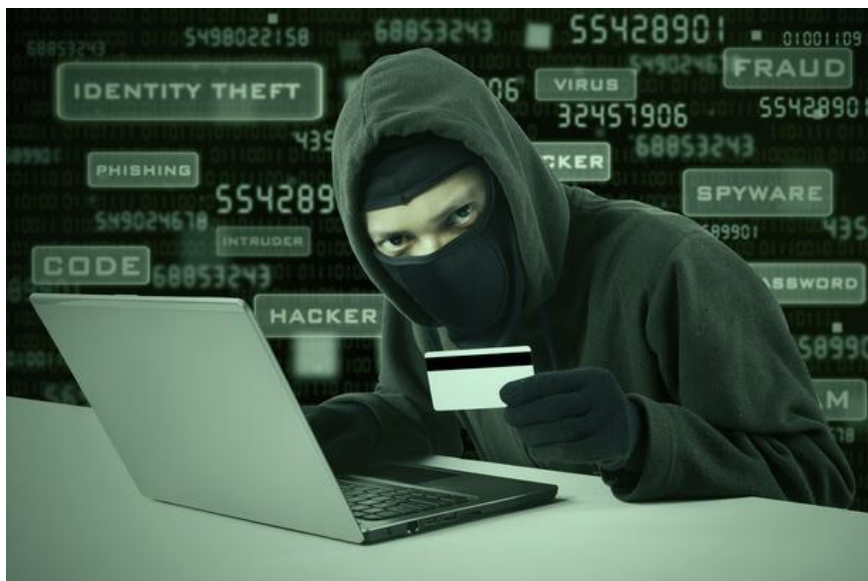
Slika 9. Haker