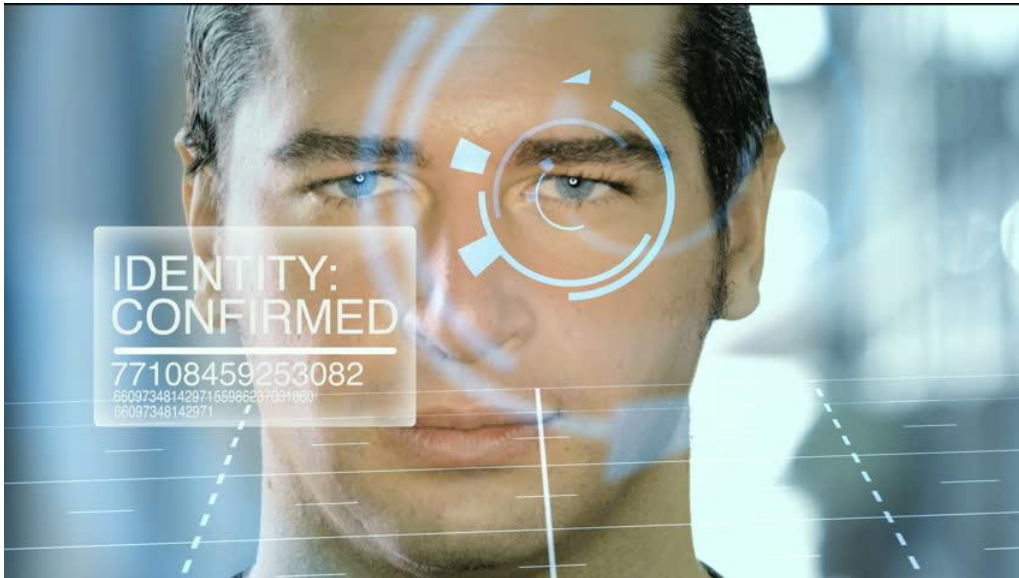
Slika 2. Identifikacija putem mrežnice oka

Izvor: http://ak8.picdn.net/shutterstock/videos/12637988/thumb/1.jpg - pristup ostvaren 15.09.2017.