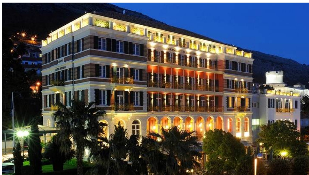
Slika 3. Hotel Imperial – Dubrovnik