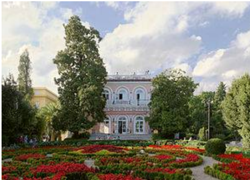
Slika 2. Villa Angiolina u Opatiji