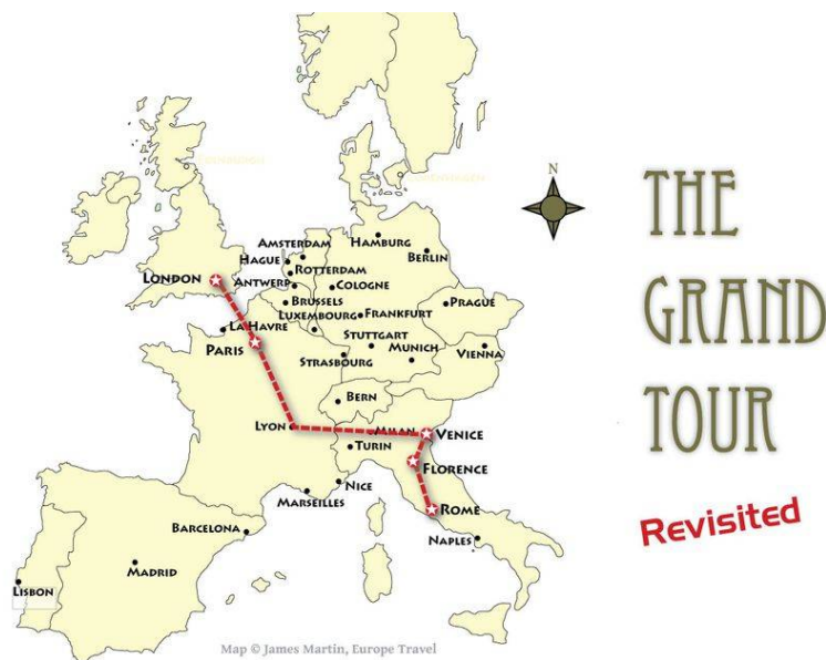
Slika 1. Grand Tour of Europe

Negdje sredinom 16. stoljeća pa sve do sredine 19. stoljeća u većem broju putuju i mladi pripadnici plemstva, aristokracije i bogatih trgovaca. Ta putovanja, poznatija pod imenom „Grand Tour of Europe“ postala su neizostavnim dijelom njihova školovanja i obrazovanja. Trajala su 2-4 godine, a obuhvaćala su uglavnom zemlje Mediterana-kolijevke civilizacije i kulture. Zbog mnogih svojih karakteristika, koje ih izdvajaju od putovanja u ranijim razdobljima, ova putovanja nazivamo „pretečom pravih turističkih putovanja“, a neki ih teoretičari nazivaju čak i međufazom između predturističke i turističke epohe.