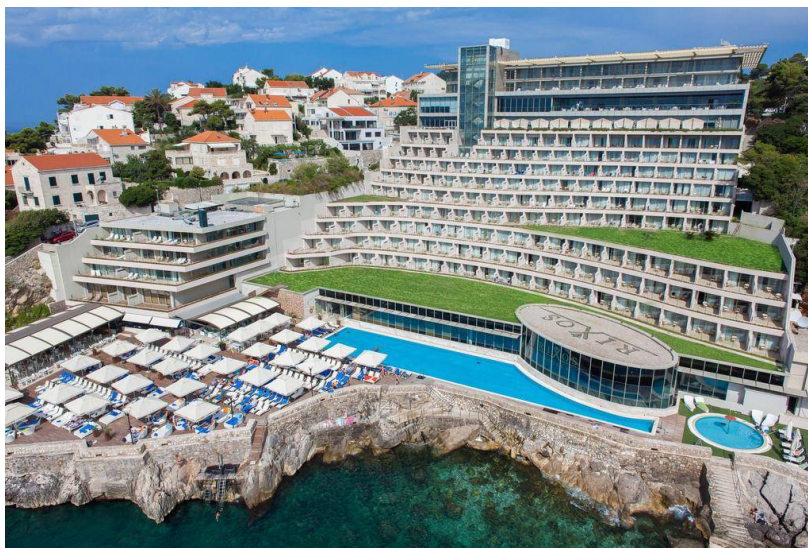
Slika 4. Hotel Rixos, Dubrovnik