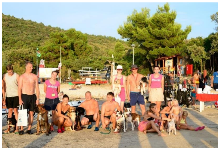
Slika 5: DogDay activities, kamp Slatina, Cres

istražuje. Objekti koji su ‘DogFriendly’ imaju dio za pse, plažu za pse te najboljem slučaju park za pse. Sve iznad toga je nešto gdje dolazi turistička animacija. Animacija se tek razvija u tom smjeru i trenutno nudi malu paletu aktivnosti koja trenutno zadovoljava tu strukturu gostiju. Od plivanja sa ljubimcima do hvatanja poslastice, aktivnosti za pse (iako još nisu postale trajni dio animacijskog program) svrstavaju se pod event animaciju. Primjer takve aktivnosti koje se odvijaju jednom tjedno/mjesečno je „Dogday“ - dan pun aktivnosti za pse gdje se na kraju bira i „najbolji pas“, „najljepši pas“ i ostalo.