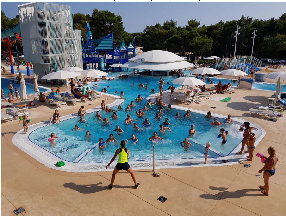
Slika 3: Aquaerobic, kamp Čikat, Mali Lošinj

animaciji i definiramo je kao aktivnost koja je određena slobodom, neizvjesnošću i koja ima svoja pravila, a u pravilu je fiktivna i uvijek izvan svakodnevnih profesionalnih pravila života.