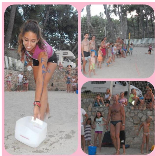
Slika 6: Familyday event, kamp Čikat, Mali Lošinj

Budućnost turističke animacije upravo je u edukaciji stručnih turističkih animatora u smislu osiguranja dodatne kvalitete ponude, a samim time i pozitivnih ekonomskih i društvenih učinaka turističke animacije. Kroz sve educiranije kadrove promoviramo posao animatora. Cilj turističke ponude je postizanje ekonomskih efekata. Animacija je ta koja doprinosi povećanju turističke potrošnje. Ponudom animacijskih programa za djecu, funkcija turizma zadovoljava potrebe djece za druženjem i promjenom, a ujedno se stječu nova znanja i vještine. Animacija kroz igru ujedno doprinosi razvoju djetetovih psihičkih i fizičkih sposobnosti i njegovu zadovoljstvu. Animacijski programi u turističkoj ponudi 21. stoljeća neophodni su kao dio sektora turizma, te imaju određeni utjecaj pri odabiru destinacije putovanja i odmora. Prema vlastitom iskustvu duboko vjerujem da će animacija sve više ići prema 'event animaciji' što znači da će se puno više fokusirati na izradu evenata poput: dana kampa, dana hotela, obiteljskog dana itd. Kao što sam spomenuo u radu vjerujem isto tako da sve više idemo i prema animaciji kućnih ljubimaca i da će sve više animacija krenuti u viralni svijet. Šta to znači? Tek ćemo vidjeti.