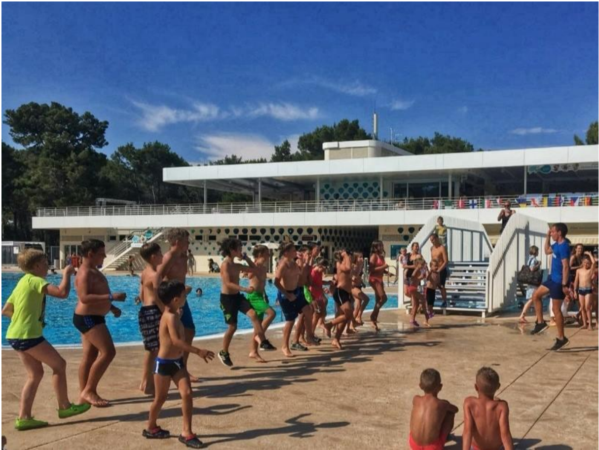
Slika 4: Teen game of the day – Fortnite dance, kamp Čikat, Mali Lošinj