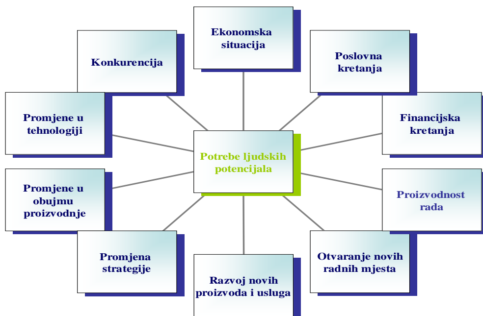
Slika 1. Faktori koji utječu na potreba za ljudskim potencijalima (str.659)

Navedene stavke ističu dugotrajnu komponentu planiranja ljudskih potreba koja rezultira usklađivanje na svim razinama poslovanja organizacije. Pravilno postavljena politika razvoja ljudskih potencijala, u konačnici, dovodi do ostvarenja konkurentskih prednosti na tržištu (Sikavica, Bahtijarević-Šiber, Pološki-Vokić, 2008: 656). Slika 1. donosi prikaz utjecaja na potrebe za ljudskim potencijalom iz koje je vidljivo da promjene u tehnologiji, financijska kretanja, ekonomska situacija imaju utjecaj na promjene za ljudskim potencijalom.