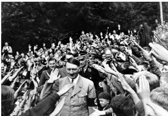
Slika 4. Adolf Hitler kao primjer retoričara negativnog utjecaja