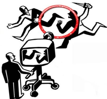
Slika 5. Medijska manipulacija

Stoga, mjere opreza nikada dosta. Često bez pažljivog promišljanja, ono što nam se najprije ponudi uzimamo kao vjerodostojnu riječ. Ali što ako dobivena riječ nije točna? Nepromišljeno ponašanje poput brzopletog dijeljenja te riječi bez prethodnog analiziranja započinje domino efekt širenja laži, a da sami pojedinci nisu ni svjesni štete koju na taj način prouzrokuju. Mi kao pojedinci ne možemo kontrolirati koje riječi se šire medijima, no možemo doprinijeti svojim oprezom i razvijanjem kritičkog mišljenja.