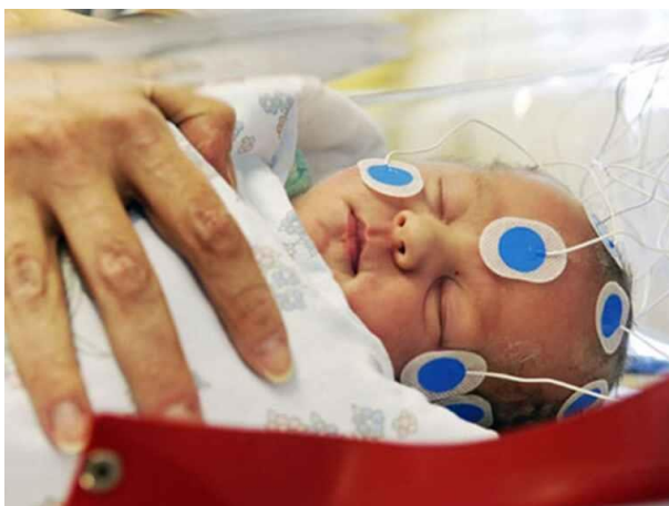
Slika 3. Dojenčad za vrijeme istraživanja

Kako riječi uistinu ostavljaju dubok trag, potvrđuju i ostale znanosti kao što su psihologija i neuroznanost. Poznato je kako osoba čuje riječi već u prvih nekoliko mjeseci svoga razvoja, još u vrijeme kada ju je majka čuvala ispod njezinog srca, u svojoj maternici. Istraživanja su pokazala da majke koje tepaju i govore svojim nerođenim bebama čine više od stimulacije – one oblikuju mozak svog djeteta. U provedenom istraživanju, skupinu djece u maternicama izložili su slušanju CD-a na kojem su bile izgovarane riječi. Nakon rođenja, učinili su isto (slika 3.). Rezultati su pokazali kako su dojenčad prepoznala riječi i promjenu visine tona, odnosno aktivnost mozga se povećala. Dakle, osobe još za vrijeme fetalnog stadija obrađuju i pamte složene informacije kao što su riječi. ( https://www.today.com/parents/unborn-babies-are-hearing-you-loud-clear-8c11005474 )