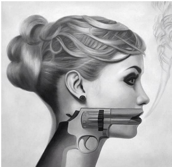
Slika 2. Gun talk, ulje na platnu

Dakle, verbalno zlostavljanje, ukoliko se ne „tretira“ na vrijeme može eskalirati u onolikoj snazi kolika je dovoljna za pokretanje sljedeće faze začaranoga kruga nasilja – fizičkog zlostavljanja – bilo da se radilo o samoozljeđivanju ili ozljeđivanju od strane druge osobe. Istraživači pokazuju kako je cilj nasilnika prvo steći kontrolu nad situacijom i žrtvom, na način da riječima potvrdi svoj autoritet i dominaciju. Dokle god je žrtva na „dijeti“ verbalnog zlostavljanja, ona s vremenom postaje ravnodušna na bilo kakve uvrede i napade. Slikovito rečeno, negativne riječi „izgladne“ žrtvin obrambeni mehanizam te kao rezultat ona jednostavno više ne može spriječiti ukoliko nasilnik „unaprijedi“ svoj verbalni nastup u fizički. ( https://studfile.net/preview/4533588/page:3/ ) Nažalost, začarani krug nasilja nerijetko završava posljednjom stepenicom – okončavanjem ljudskoga života.