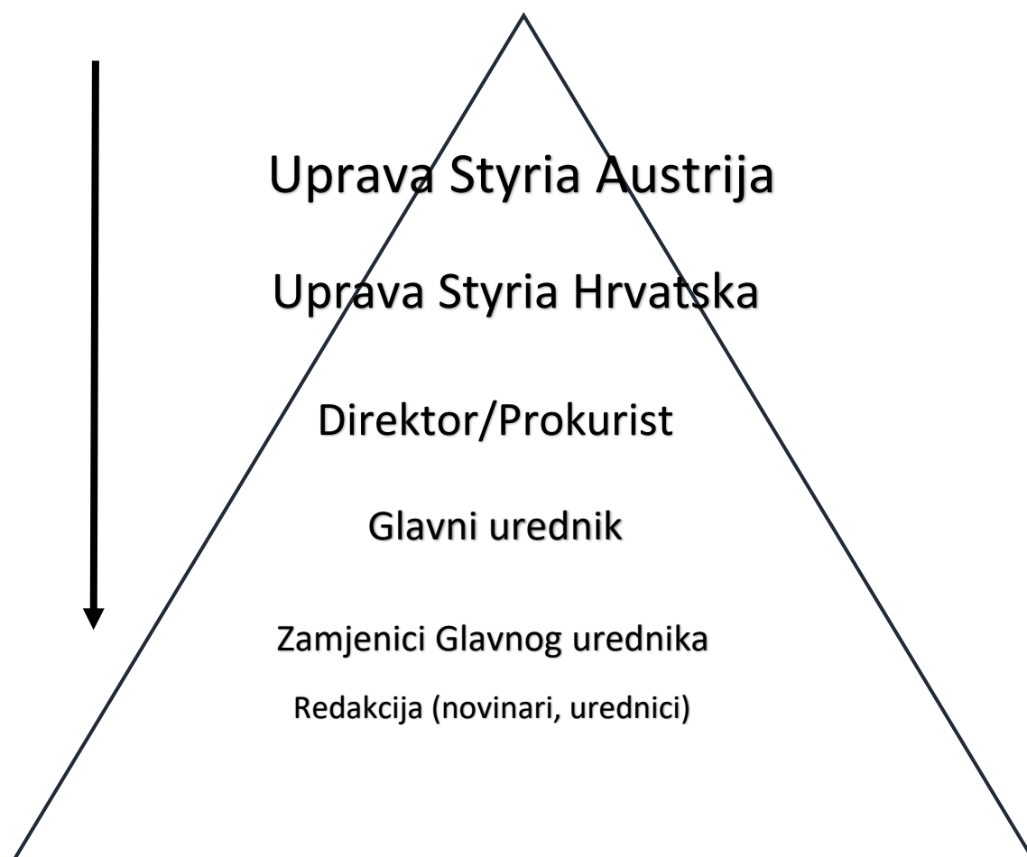
Slika 1. Upravljačka struktura. 25

Menadžerska struktura unutar grupacije će se objasniti sljedećim shematskim prikazom. Ona ima naravno oblik piramide koji se oblikuje od vrha prema dnu. Od „najbitnije“ menadžerske pozicije do operativne pozicije unutar grupacije. Ovaj shematski prikaz primjenjiv je na sve tvrtke unutar same grupacije ( Večernji list, Poslovni dnevnik i 24sata ).