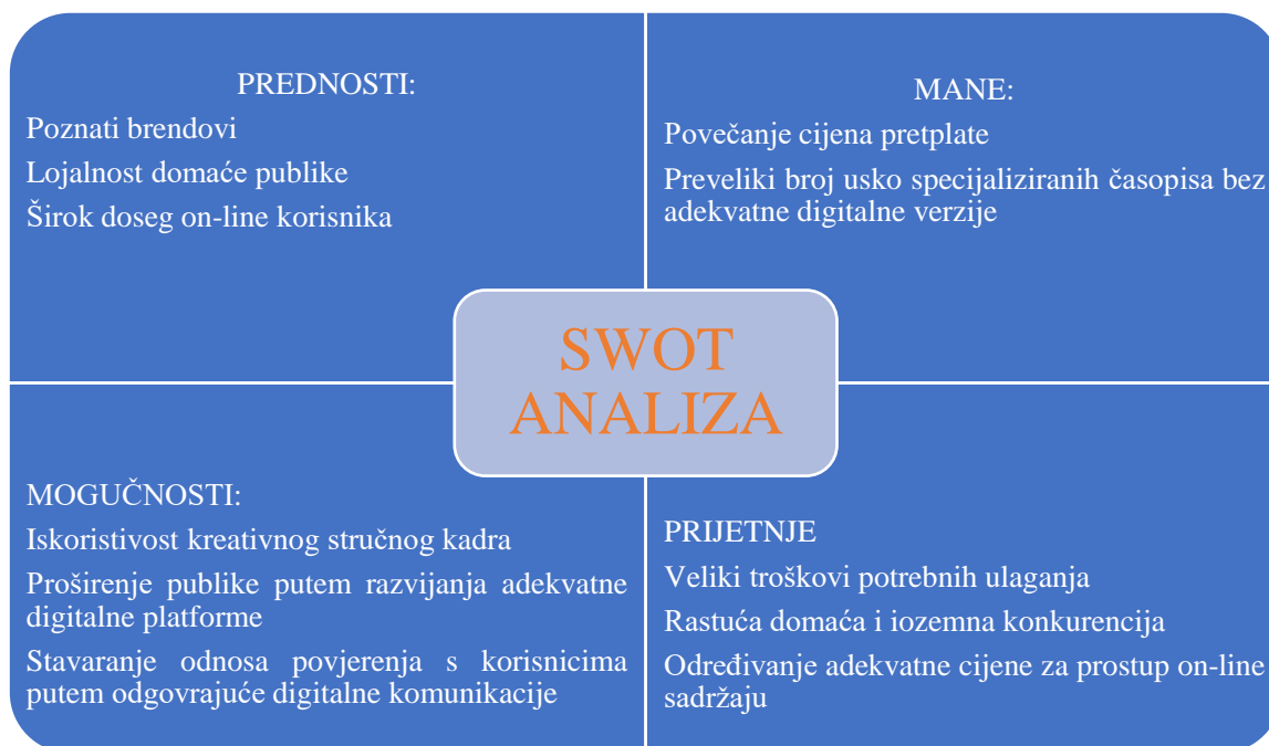
Slika 4. SWOT analiza Hanza Medije. 40

S obzirom na dostupnost javnosti podataka o poslovanju Hanza Medie, kao i na uvjete okoline unutar koje posluje slijedi sljedeći grafički prikaz SWOT analize Hanza Medie: