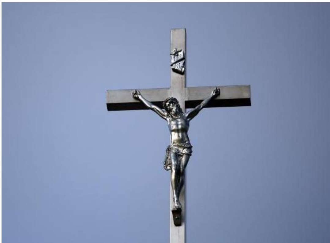
Slika 7. Katolički križ,