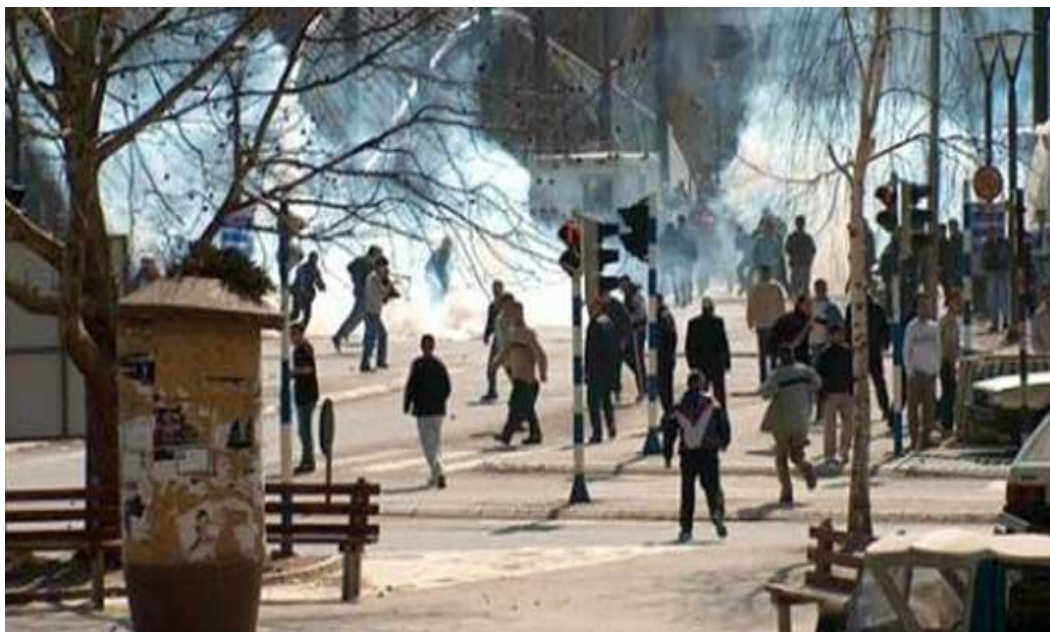
Slika 9. Jedan od mnogih sukoba na Kosovu između Srba i Albanaca