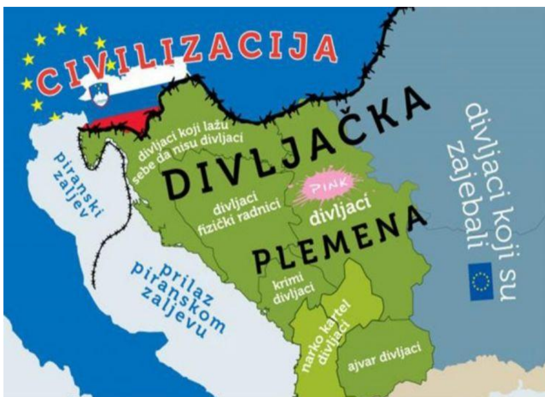
Slika 2. Slikoviti prikaz predrasuda na Balkanu

“I ovdašnji su mediji, političari, znanstvenici, umjetnici i ostala intelektualna elita pridonijeli stvaranju neiskorjenjive “balkanske mržnje”, proizveli slike o Balkanu kao najzaostalijoj europskoj regiji, što potvrđuju i tzv. mikrobalkanizmi vidljivi u tendencijama svakog ovdašnjeg naroda da svoga susjeda promatra kao neprijatelja (Slovenci Hrvate, Hrvati Srbe, Srbi Bošnjake i Albance...). Balkan je tako predstavljen kao predvorje barbarskog Istoka, a granica se pomiče sve istočnije, ovisno o nacionalnom kontekstu iz kojega promatramo. Čitava konstrukcija o Balkanu (i Jugoistočnoj Europi), ovdašnjem prostoru, vođama, narodima i vjerama izaziva kod dobrog dijela stanovnika osjećaj da živimo u nekom sivilu i beznadu iz kojega ne možemo, a i ne želimo pobjeći.” 4