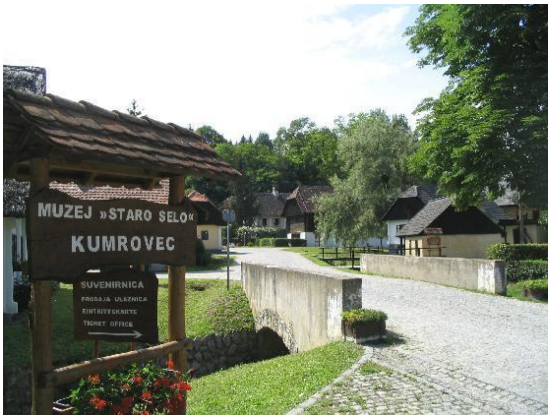
Slika 5. Kumrovec, rodno mjesto Josipa Broza Tita, predsjednika Socijalističke Federativne Republike Jugoslavije