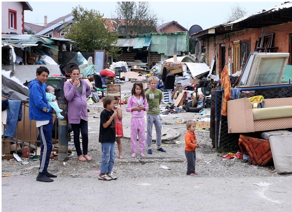
Slika 10. Romska obitelj iz zagrebačkog naselja Kozari put

uspoređivanju s lopovom, kradljivcem, čovjekom u čije se poštenje i namjere sumnja. U hrvatskom jeziku ta riječ se koristi isključivo u pejorativnom značenju. 36