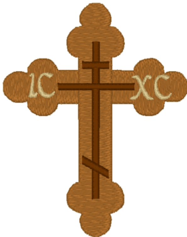
Slika 6. Pravoslavni križ,

Opet, tri glavne vjere na našim prostorima imale su veliki značaj za stvaranje i očuvanje kulturnog i etničkog identiteta, i iako se vjerske institucije u SFRJ ne mogu direktno optuživati za poticanje rata, one su svakako mogle učiniti mnogo više za njegovo sprečavanje, ili liječenje njegovih posljedica, tako da u tom smislu i one snose dio odgovornosti za ono što se tu zbivalo u periodu od 1991. – 1995.