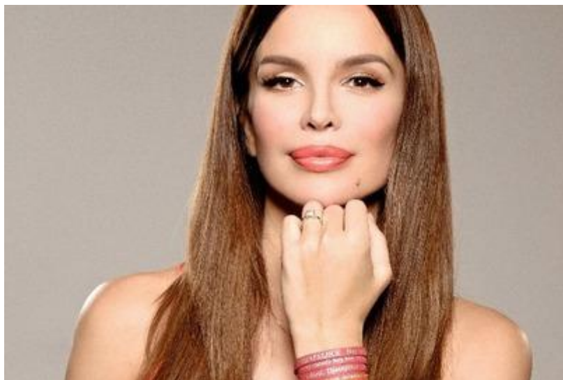
Slika 4. Severina Vučković, najpoznatija i najpopularnija hrvatska pjevačica, protagonistica hrvatskog turbo-folka