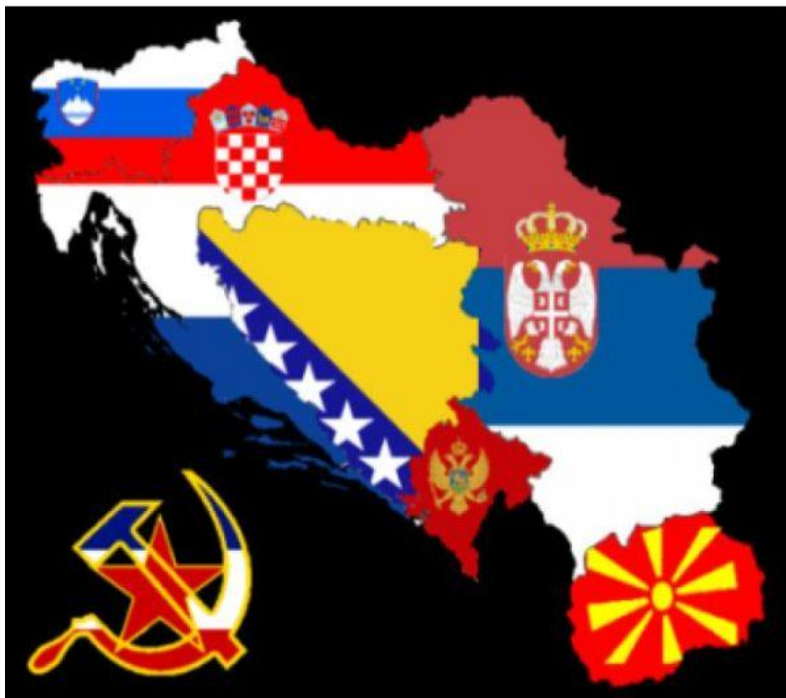
Slika 1. Karta zemalja bivše Jugoslavije