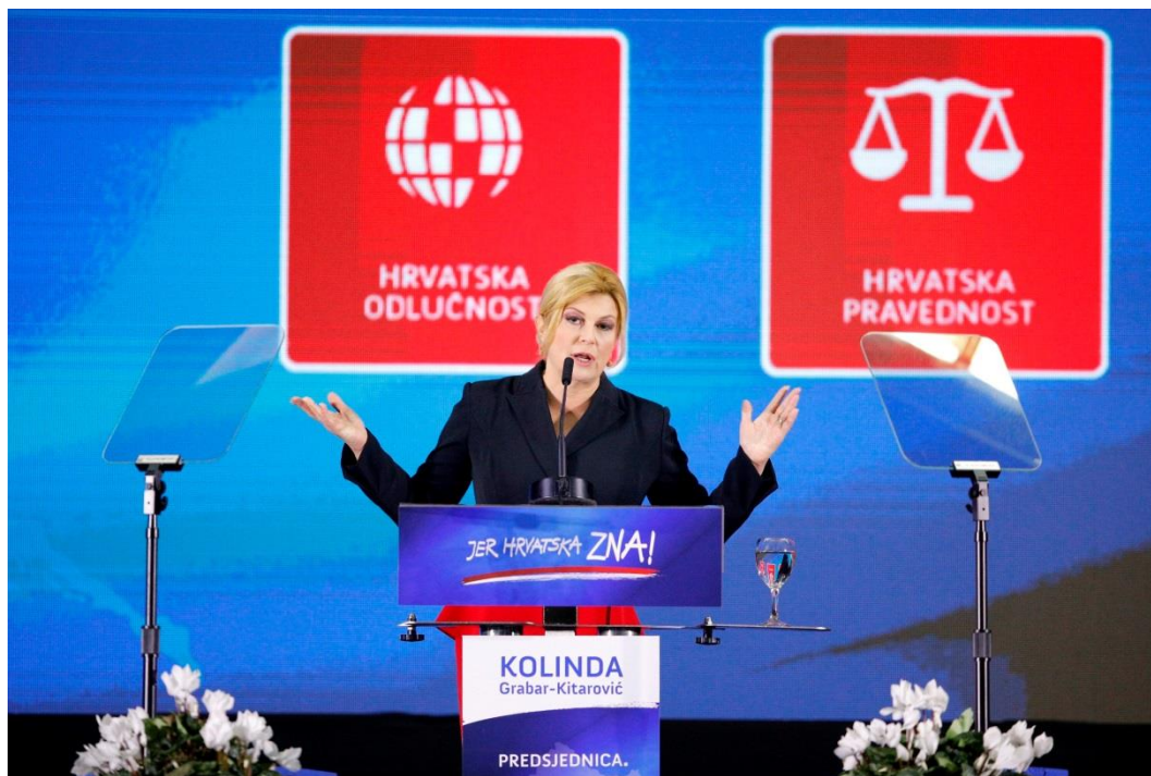
Slika 3. Govor na predstavljanju programa za drugi mandat