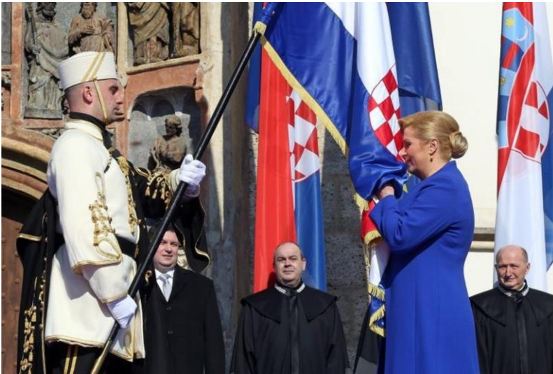
Slika 2. Inauguracija predsjednice Kolinde Grabar Kitarović

Konačno, prvo je dan uvid u definicije ovlasti te pobliža objašnjenja usporednih razina i karakteristika ovlasti i pozicije predsjednika pojedinih država, da bi se zatim pojedinih predsjedničkih pozicija tih zemalja usporedile s onima Republike Hrvatske, a sve u svrhu toga da se dobije točan uvid u kakvim je institucionalnim i regulatorno-ustavnim uvjetima bivša predsjednica Republike Hrvatske djelovala. Navedeno je bitno da bi se stvorila slika okvira, dopuštenja, prava, ali i potencijalni izazova i poteškoća na koji je predsjednica mogla naići i pripremiti se s obzirom na njezinu poziciju, utjecaj te pozicije, i ovlasti dane pozicijom u Hrvatskoj.