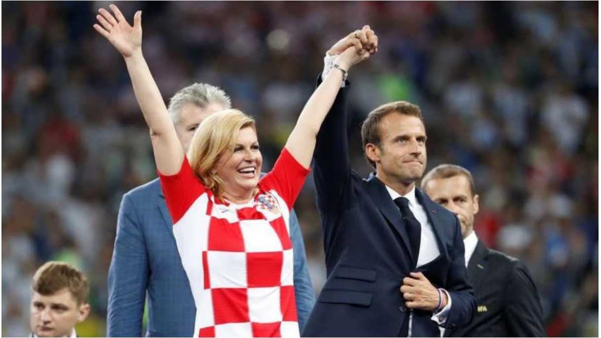
Slika 10. Slavlje na dodjeli medalja Svjetskog nogometnog prvenstva. 48

Svi se dobro sjećamo Svjetskog nogometnog prvenstva u Rusiji 2018., kada su vatreni došli do finala, no izgubili su protiv Francuza i tako su ipak izborili drugo mjesto u Svjetskom nogometnom prvenstvu. I svi se dobro sjećamo tadašnje naše predsjednice koja ih je bodrila sve do kraja, a ( Slika 10. ) upravo prikazuje njezin izraz lica nakon dodjele medalja. Kako mnogi kažu, ukrala je pozornost medija nakon što se prema njezinim riječima nije više mogla izdržati i zadržavati sreću, te je izašla na teren i počela je grliti sve redom, od nogometaša naše momčadi, pa sve do Francuza, jer ipak je pristojno i sportski pružiti ruku pobjednicima, ili ih u ovom slučaju zagrliti jednog po jednog.