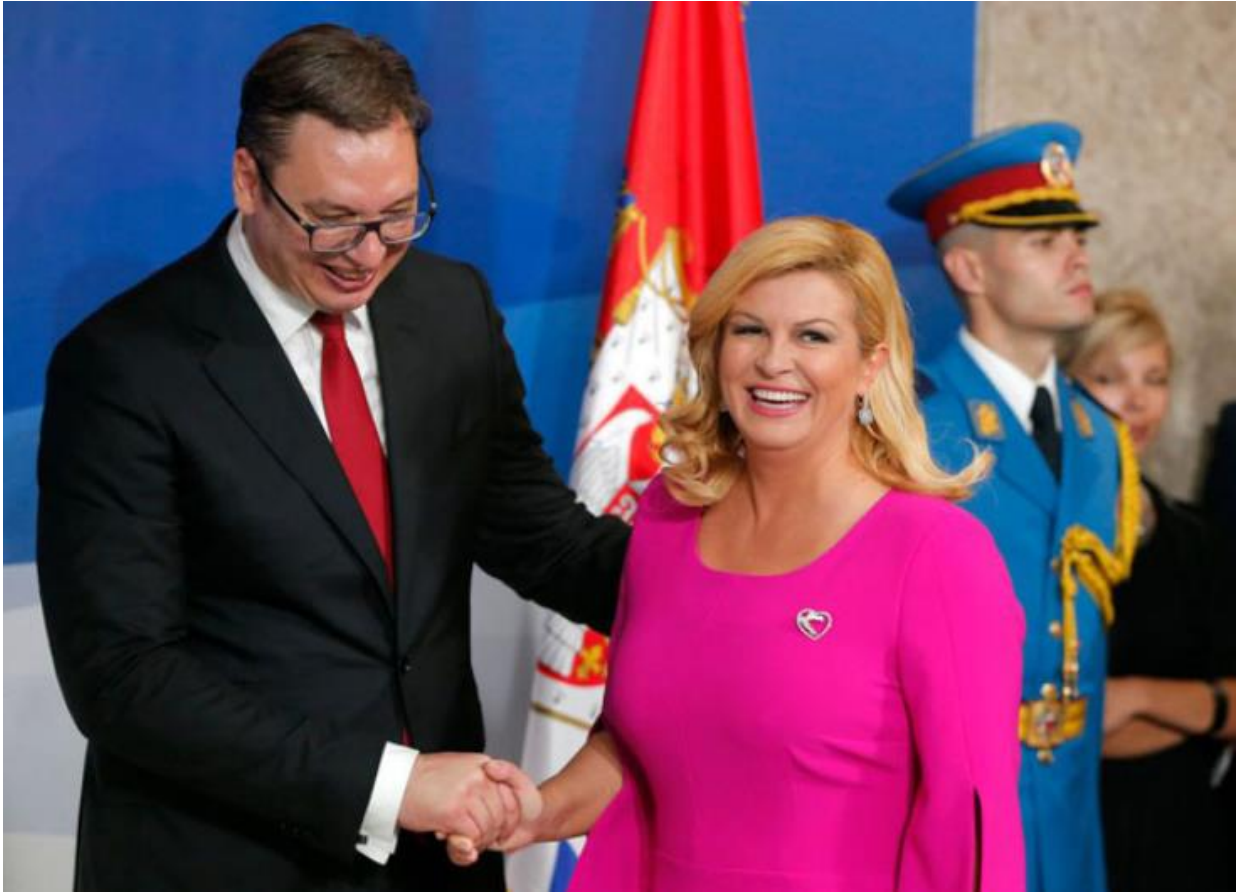
Slika 26. Bivša predsjednica na inauguraciji predsjednika Vučića. 70