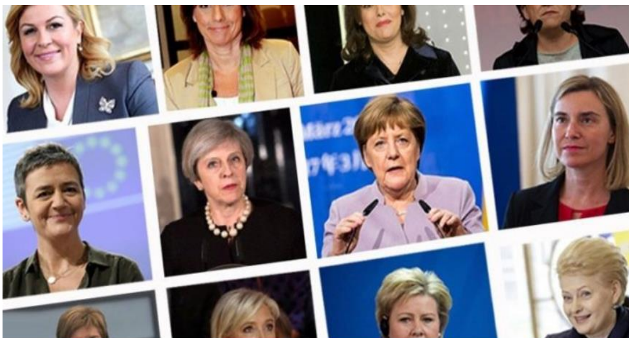
Slika 5. Žene u politici. 42

žena na dno liste – vješto izbjegavaju. Puno bismo više postigli da uvrstimo u Zakon o ravnopravnosti spolova propise poput Norveške koja propisuje obveznu 40-postotnu zastupljenost žena u parlamentu. Iako je do danas učinjeno puno po pitanju ravnopravnosti spolova i prava žena – za njihovo promicanje i napredak još uvijek ima mjesta. Postoji još mnogo područja na kojima žene bivaju zakinute za svoja temeljna prava. Žene u zemljama sjeverne Europe danas osjećaju najmanje rodnog jaza. Položaj žena u nordijskim zemljama trebao bi biti cilj svih nas, a da je rodna ravnopravnost moguća one su očiti dokaz.“ 41