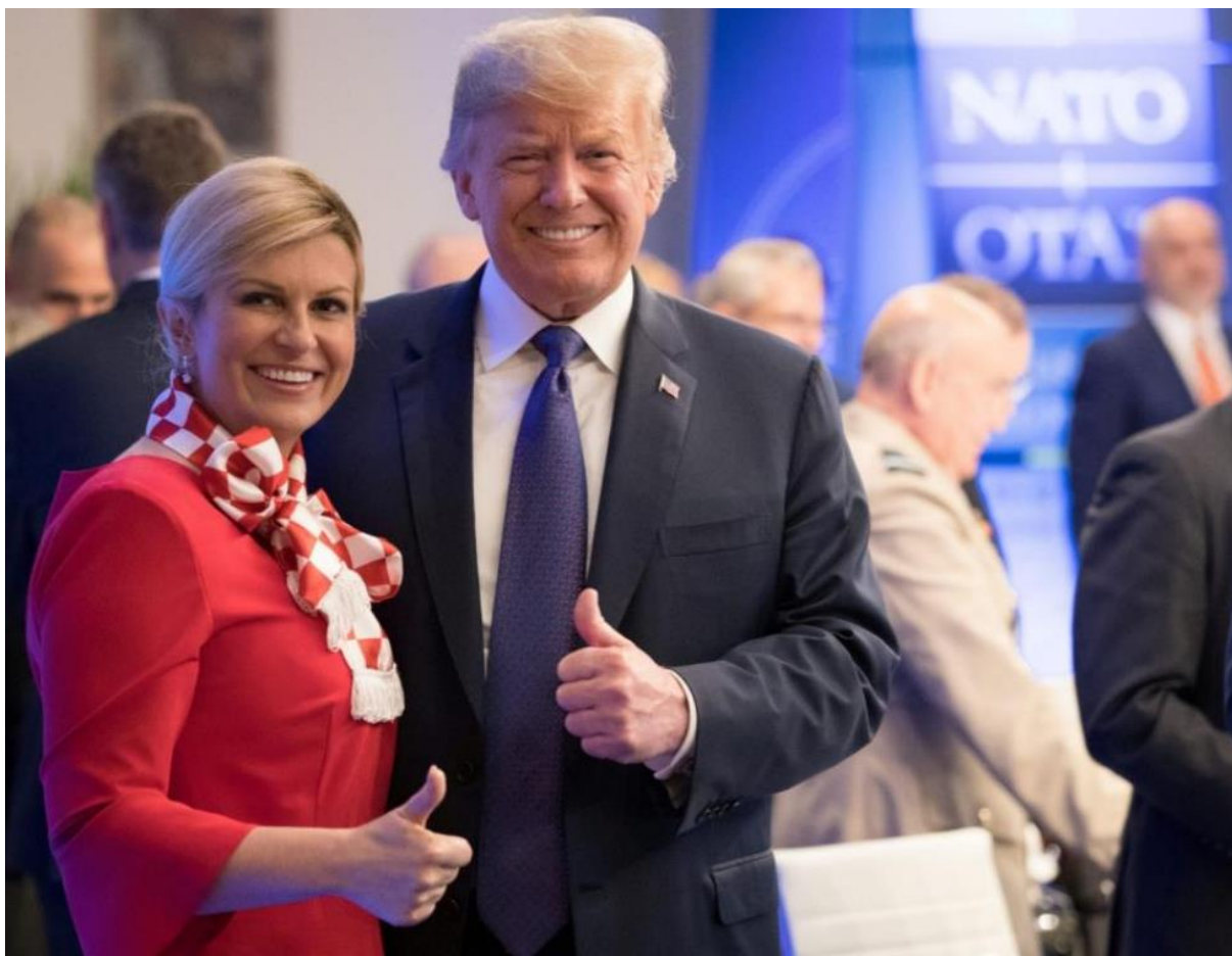
Slika 13. Druženje predsjednika SAD-a i predsjednice Hrvatske. 53

Kao što ( Slika 12. ) prikazuje, bivša predsjednica se nalazila u društvu predsjednika Trumpa na summitu NATO-a. Sa njezinog lica dalo se je iščitati da je situacija bila veoma ugodna i ležerna, te nije bilo nekih neugodnih tekućih pitanja između zemalja. Atmosfera je bila ugodna tokom cijelog dana summita , što pokazuje i sljedeća fotografija ( Slika 13. ) koja prikazuje predsjednike država u bliskom kontaktu, te pokazuju prst gore koji najčešće znači da je sve u redu.