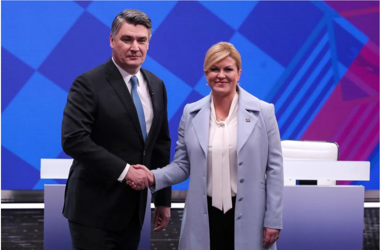
Slika 24. Kolinda Grabar-Kitarović nosi broš sa zastavom Hrvatske. 67

Bilo da se radilo o broševima (npr. prilikom debata za borbu na predsjedničkim izborima ove godine Kolinda Grabar-Kitarović je nosila broš sa zastavom republike Hrvatske ( Slika 24. )), ali i u prethodnim ulomcima se je moglo vidjeti da kada god je u posjeti nekim drugim državama i kada god je u mogućnosti promovirati Hrvatsku, uvijek je to radila sa stilom ( Slika 15. ). Kada je bila u društvu predsjednika Putina, odlučila se je za maslinasto-zelenu kombinaciju kompleta, a sako je imao na sebi crnu Pašku čipku. Ali i sam odabir boja kompleta i haljina, najčešće u crvenoj, nježno plavoj, čak i kraljevsko plavoj boji. Boje zastave Republike Hrvatske.