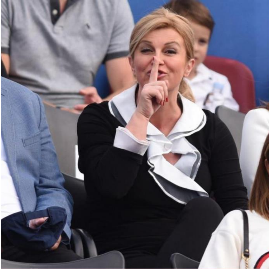
Slika 18. Kolinda Grabar-Kitarović na teniskom turniru. 59

(Slika 18.) je nešto novija fotografija koja je uslikana nakon izgubljenih predsjedničkih izbora. Nakon njezine neverbalne komunikacije i pokazivanja srednjeg prsta na Škorine kontroverzne izbore, mnogi smatraju da je ova i fotografija, te pokazivanje ovog prsta također upućeno lideru Domovinskog pokreta. Neverbalnom komunikacijom mu pokazuje kako mu je bolje da šuti i ne govori mnogo, jer većina njegovih izjava povrjeđuje žene. 60