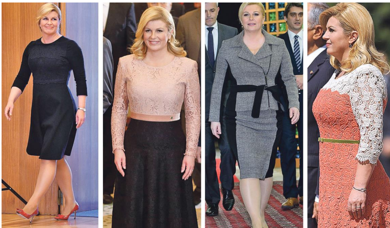
Slika 23. Stil odijevanja bivše predsjednice. 66

Ono što ju veoma razlikuje od svih prethodnih predsjednika Republike Hrvatske jest činjenica da je žena. Te, kao što se je to već kroz rad spominjalo, žene u politici nemaju veliku ulogu i značajnu ulogu. Čak i sada bez obzira što se radi o predsjedniku neke države, odnosno predsjednici države, mnogi su mediji na njezinim pojavljivanjima u javnosti komentirali vitku liniju i pisali o dijetama na kojima je bila i koje je koristila, te modni izričaj Kolinde Grabar-Kitarović. Javnost je bila više upućena u to da je dovela liniju »u red«, te kojeg je hrvatskog dizajnera ovaj put nosila, nego u to što je bilo rečeno na nekom sastanku ili obraćanju javnosti. I ono što mediji često ističu, a išlo je u korist bivšoj predsjednici jest to što je uvijek promovirala hrvatske dizajnere i nosila elemente koji promoviraju hrvatski identitet.