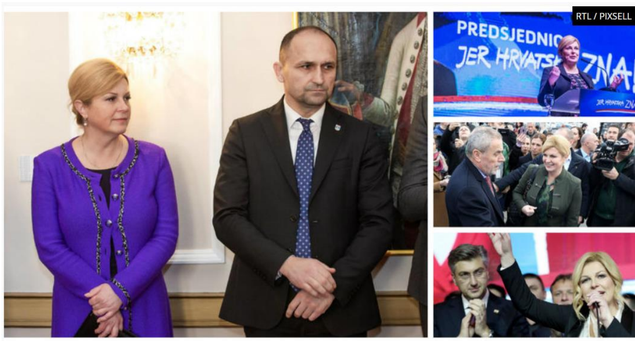
Slika 37. Osobni prostor i teritorij Kolinde Grabar – Kitarović. 94

povreda dogodila, hoće li se ponoviti ili ne i sl. Svaka osoba ima svoj teritorij i svaka će osoba drugačije reagirati na njegovu povredu. Isto tako svaka osoba ima svoj tzv. osobni prostor, svojevrsnu nevidljivu granicu u kojoj se osjećaju ugodno. Prelaskom te granice, neke druge osobe s kojom osoba nije dovoljno bliska, u prvoj osobi može se i često se budi osjećaj nelagode. Ovisno o bliskosti osoba će pustiti druge u svoju blizinu.“ 93