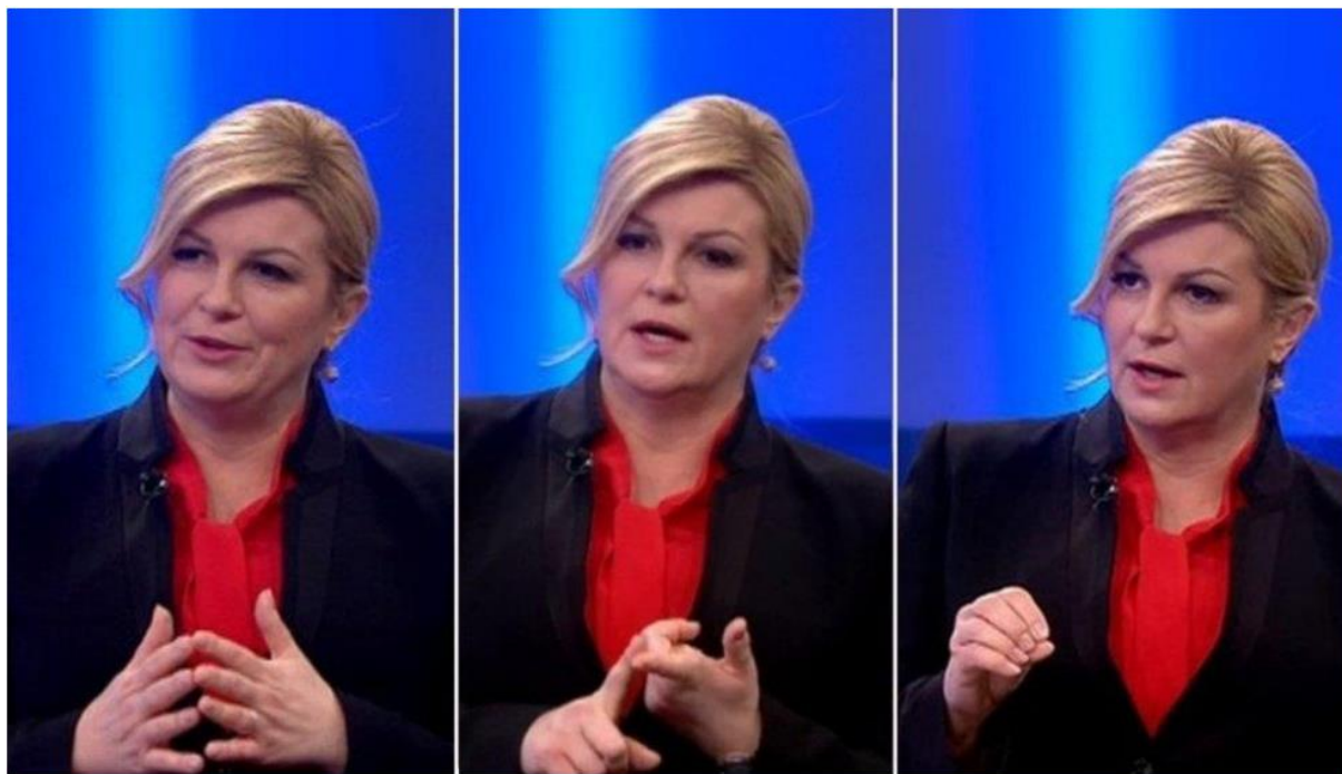
Slika 16. Nabiranje kao dio neverbalnog govora. 57

Ovdje je dr. sc. Diana Tomić u pravu te se na licu ( Slika 16. ) Kolinde Grabar-Kitarović vidi veoma neprirodna i uvježbana gesta nabiranja koju nije uskladila sa verbalnom komunikacijom, čak se vidi i uznemirenost, te korištenje općenitih teza kako bi izbjegla konkretne odgovore na pitanja.