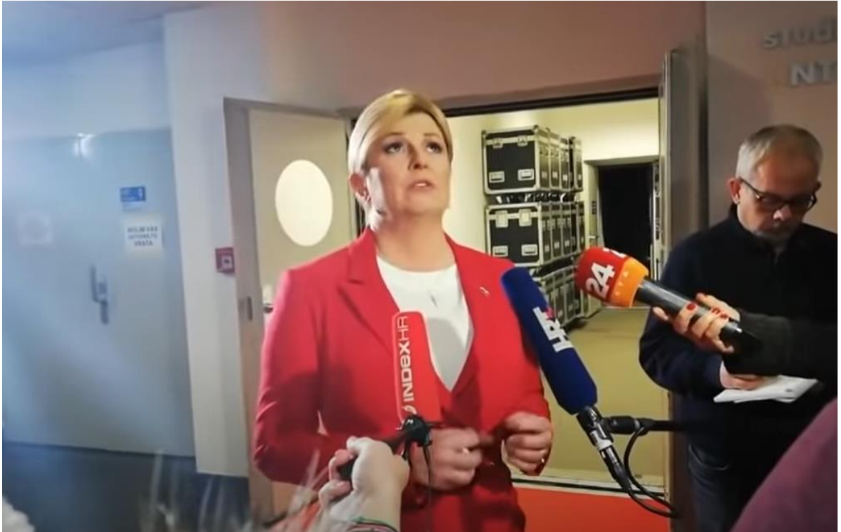
Slika 9. Grabar-Kitarović odgovara na pitanja nakon debate. 47

Iako se može zaključiti kako joj vizualna komunikacija nije strana kada je ugodna atmosfera i kada je okružena ugodnim pitanjima i stavovima. Ako je okružena nekim neugodnim pitanjima poput afere Kontinental prijevoza, bivša predsjednica gubi integritet.