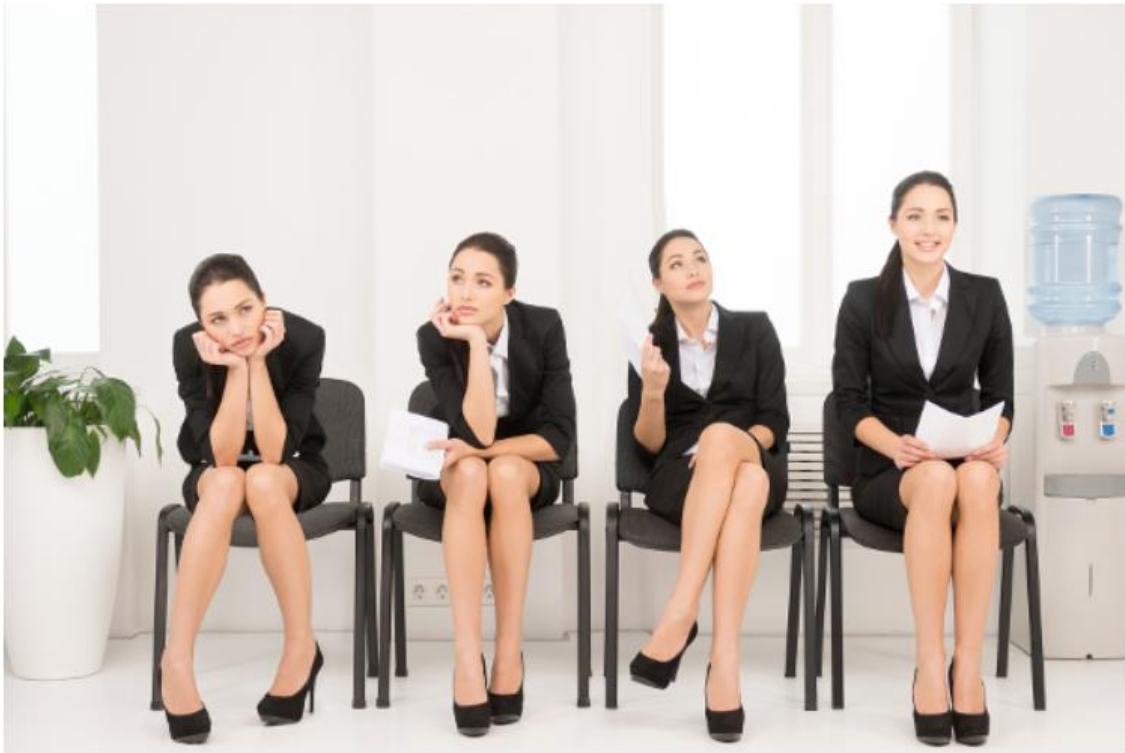
Slika 3. Govor tijela kao dio neverbalne komunikacije. 15

„Ako osoba s kojom pričamo nije okrenuta direktno prema nama to može značiti da je nervozna ili sramežljiva. To također može značiti da ta osoba ne želi pričati s nama. Ili ako netko sjedne bliže ili dalje od nas može značiti da pokazuje sigurnost, snagu ili kontrolu okoline. Poze poput uspravnog ili snuždenog sjedenja može upućivati na mentalno stanje osobe. Ruke u džepovima su znak nepoštovanja u većini zemalja. U Gani i Turskoj znak nepoštovanja je sjedenje s prekriženim nogama.“ 16