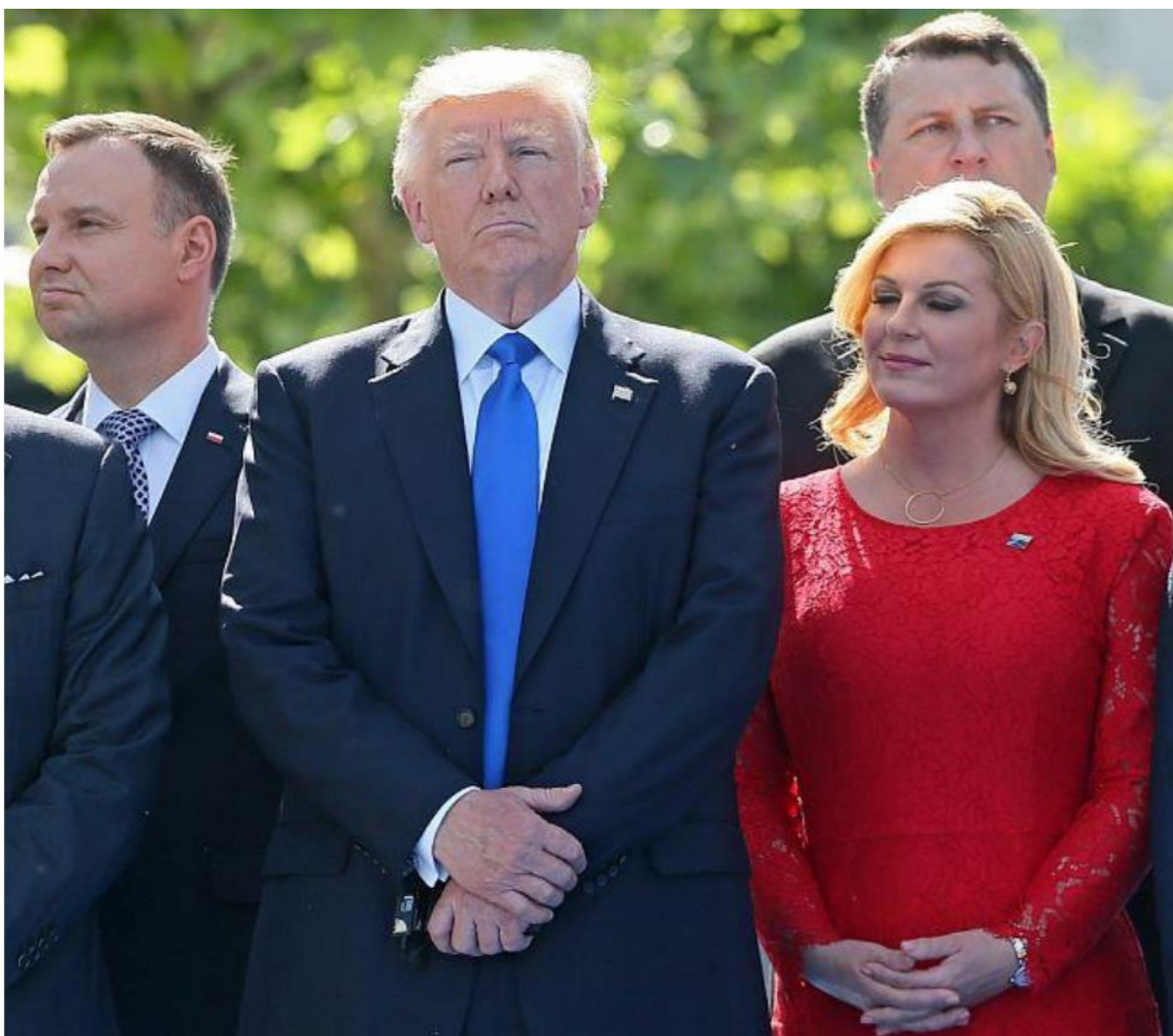
Slika 12. Kolinda Grabar-Kitarović u društvu predsjednika SAD-a. 52

Prva slika pokazuje lagani podsmijeh i Grabar-Kitarović tu još ne vjeruje što se je dogodilo. Dok je informacija o porazu došla do nje, iz druge slike i lažnog osmijeha se vidi kako joj nije drago. Zna da se mora osmjehnuti pa za to koristi ovaj lažni osmijeh, kojim pokazuje zube i usnice koje su razvučene u osmijeh, no oči su joj mirne i ne smiju se. Tek treći osmijeh je bio onaj iskren, no oči su joj tu tužne. Iako je po samom ulasku u dvoranu zapjevala i u govoru je čestitala aktualnom predsjedniku, te je svoje birače umirivala kada su negodovali zbog rezultata, smatram da joj je poraz teško pao, te da se je nadala novom mandatu.