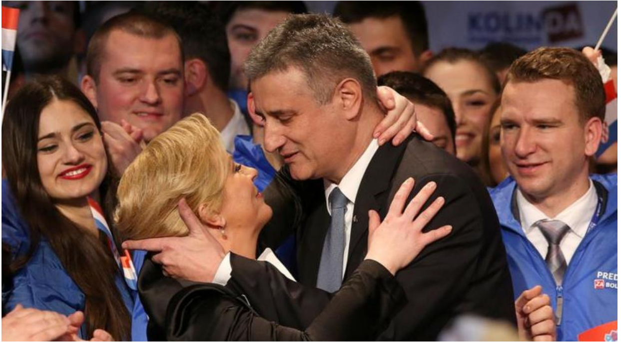
Slika 35. Kolinda Grabar-Kitarović grli Tomislava Karamarka 91

Slike 33. - 35. zorno prikazuju uzbuđenje i ugodnu atmosferu koji su ponijeli Kolindu Grabar – Kitarović tijekom Svjetskog prvenstva, te blizak odnos s političarem Tomislavom Karamarkom. No, dominantan odnos nije imala ni sa kim, te se najčešće opušteno i dominantno osjećala u situacijama gdje je Hrvatska u bliskim odnosima sa drugom zemljom i ne postoje tzv. otvorena pitanja, odnosno nerazriješena pitanja između zemalja.