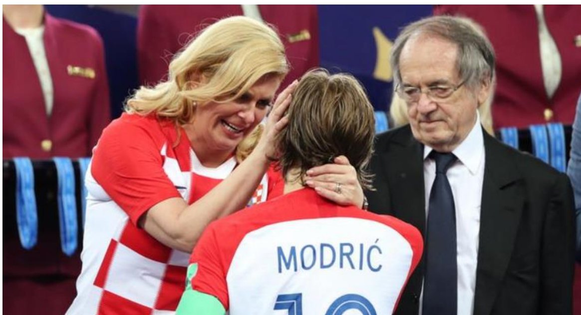
Slika 33. Uzbuđenje na licu Kolinde Grabar – Kitarović. 88