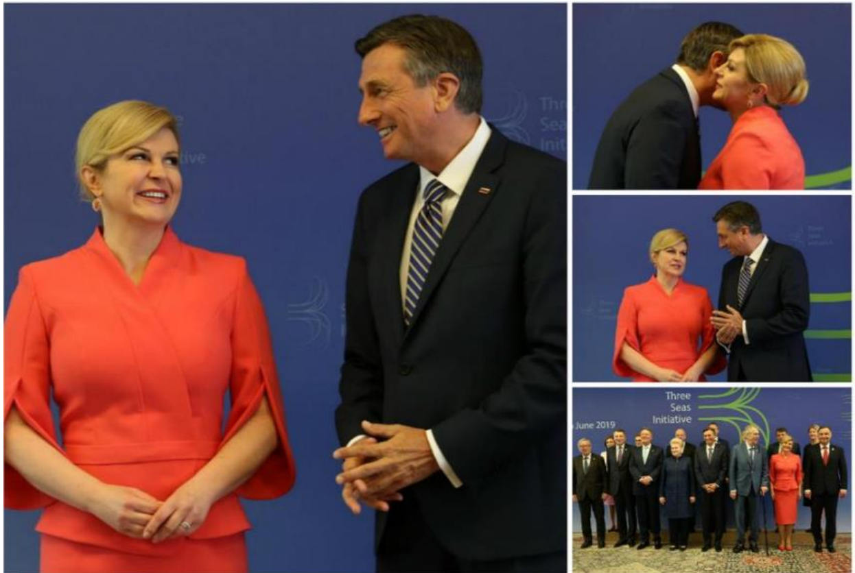
Slika 27. Kolinda Grabar-Kitarović u društvu predsjednika Boruta Pahora. 71

Ovdje se je mnogo pisalo u medijima o njihovoj bliskosti i razmijeni osmijeha. Zapravo svaki put kada bi se ovo dvoje predsjednika sastalo, mediji su uvijek pisali o tome koliko su bliski i nasmijani. Čak je Slovenija bila i posljednja država koju je predsjednica posjetila za vrijeme mandata. Izgleda da je jako bitno održati prijateljske odnose sa susjednom državom Slovenijom.