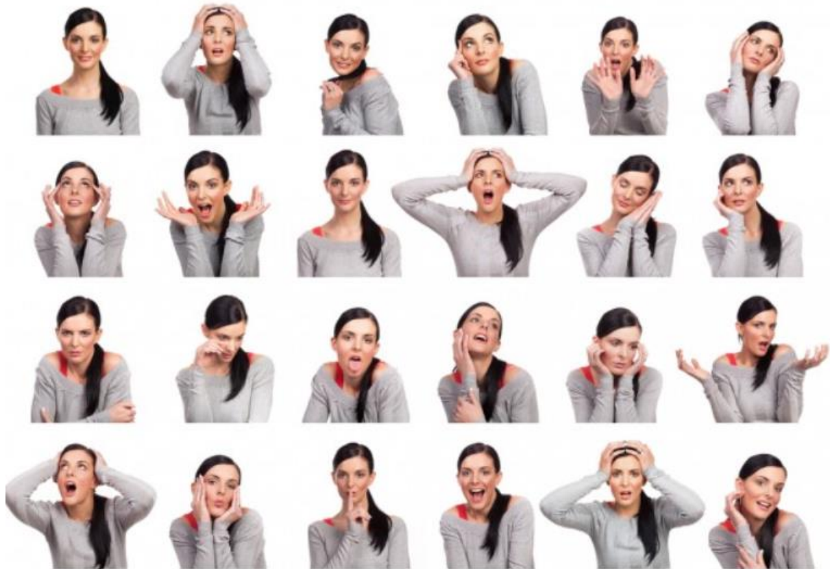
Slika 2. Izraz lica koje pokazuje osjećaje i emocije. 11