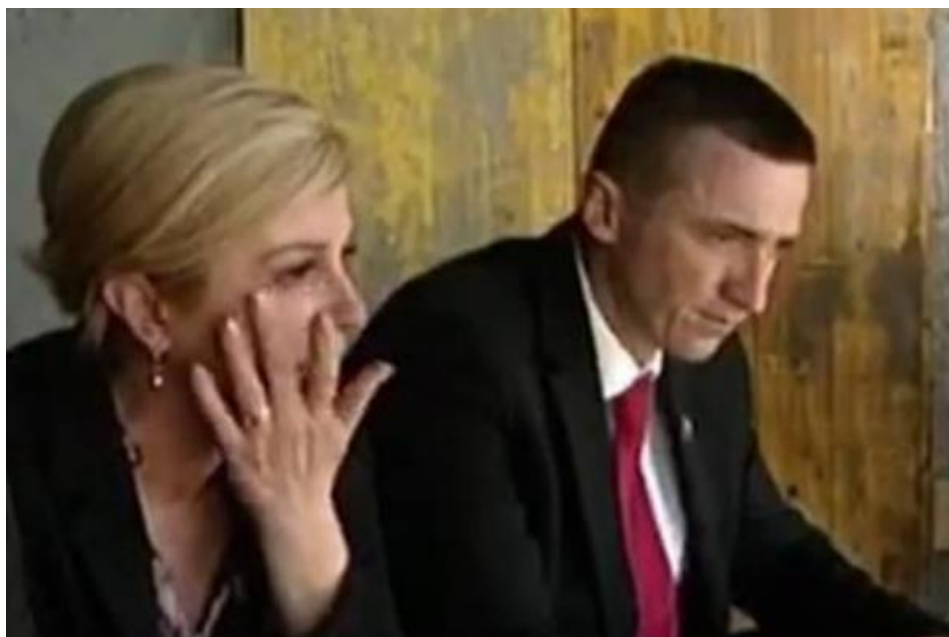
Slika 34. Emocije na licu zbog posjeta Vodotoranju. 89

Nije skrivala niti emocije u trenutku kada se je popela na Vodotoranj u Vukovaru.