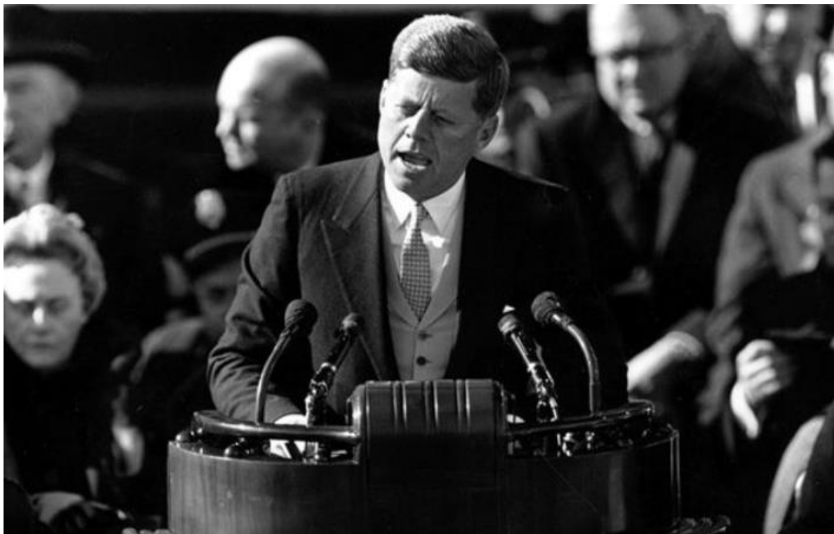
Slika 3. Kennedy održava govor na inauguraciji. 33

Iako se nije mnogo promijenilo danas i još uvijek je SAD na rubu ratovanja i siromaštva, Kennedy je šezdesetih godina mnogima dao nadu za bolje sutra.