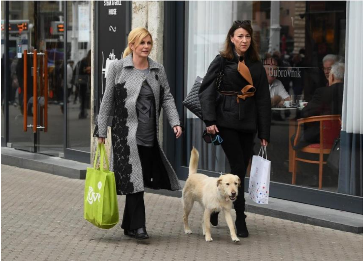
Slika 32. U šetnji sa psom. 84