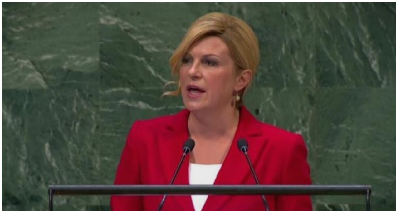
Slika 21. Grabar-Kitarović održava govor (javna zona). 64

Za kraj postoji i javna zona. Ona je prikazana ( Slika 21. ) kao što je održavanje govora. U ovoj zoni nema bliskih kontakata i komunikacije između više ljudi, već svi slušaju govornika.