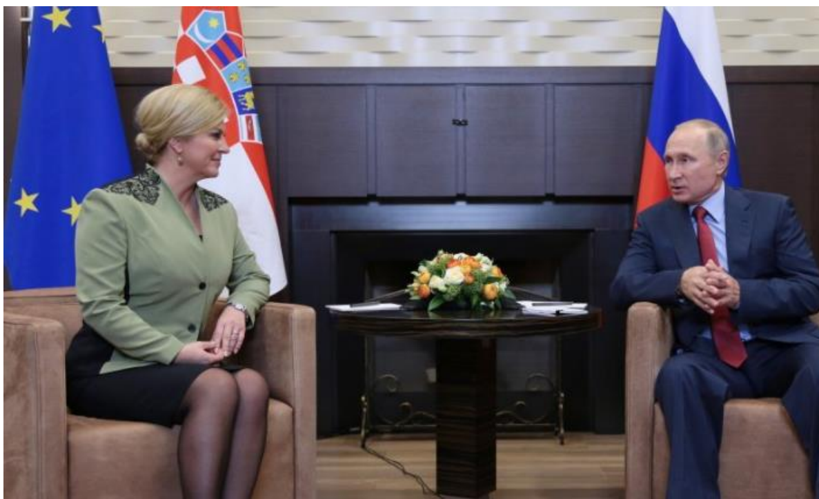
Slika 14. Bivša predsjednica na sastanku sa predsjednikom Putinom. 54

Govor tijela bivše predsjednice bio je uvijek i na svakom događanju uvježban. Naravno, ako se je nalazila u nekoj opuštenijoj atmosferi i ona je bila opuštenija, s time i prirodija, jer što je više uvježbavala neverbalnu komunikaciju, to se je više odmicala od prirodne sebe, te su neke geste postale »umjetne«.