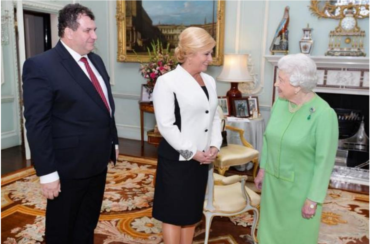
Slika 28. Kraljica Elizabeta II. u posjetu Zagrebu. 72

„Prema protokolu, član kraljevske obitelji prvi pruža ruku, a zagrljaji i poljupci u obraz ne drže se pristojnima. Inače, dok mnogi protokolarni stručnjaci drže kako se u svečanim prigodama preporučuje odjenuti tamnije boje i nešto decentnije modele, pa tako i na audijenciji kod britanske kraljice, 24sata saznaju od sugovornika bliskog predsjednici da britanski dvor ne voli monokronu crnu odjeću za žene. Čak mole da se na balove ne dolazi u crnim haljinama. Stoga, uglavnom sve zapadne državnice na audijencijama nose kostim, najčešće kombinacije crne i neke druge boje.“ 73