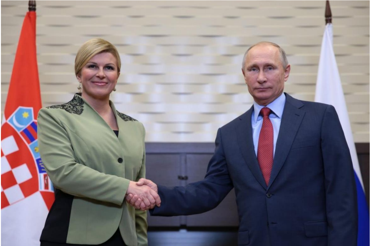
Slika 15. Rukovanje bivše predsjednice i predsjednika Putina. 55

Blagi osmijeh predsjednice pokazuje kako je sve već uvježbala i spremna je na sva pitanja i raspravu. Lagana samouvjerenost. Dok s druge strane, predsjednik Putin, bez osmijeha ili neke pretjerane neverbalne komunikacije, no čini se kako je on godinama trenirao za lice bez emocija.