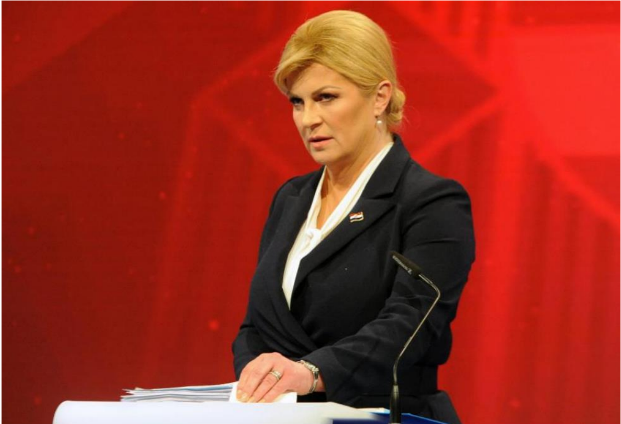
Slika 7. Rekacija Kolinde Grabar-Kitarović za vrijeme debate. 44

No, debate nisu bile jedine kao primjer odličnog kontakta očima. Tu su i mnoga druga upoznavanja, okupljanja i sastanci. Jedan takav primjer je sjednica »Inicijativa triju mora u izazovnom međunarodnom kontekstu« gdje se je u Bukureštu 2018. godine sastala sa predsjednicima Rumunjske, Republike Poljske, predsjednikom savezne Republike Austrije i povjerenicom Europske komisije za regionalni razvoj Corina Cretu. 45