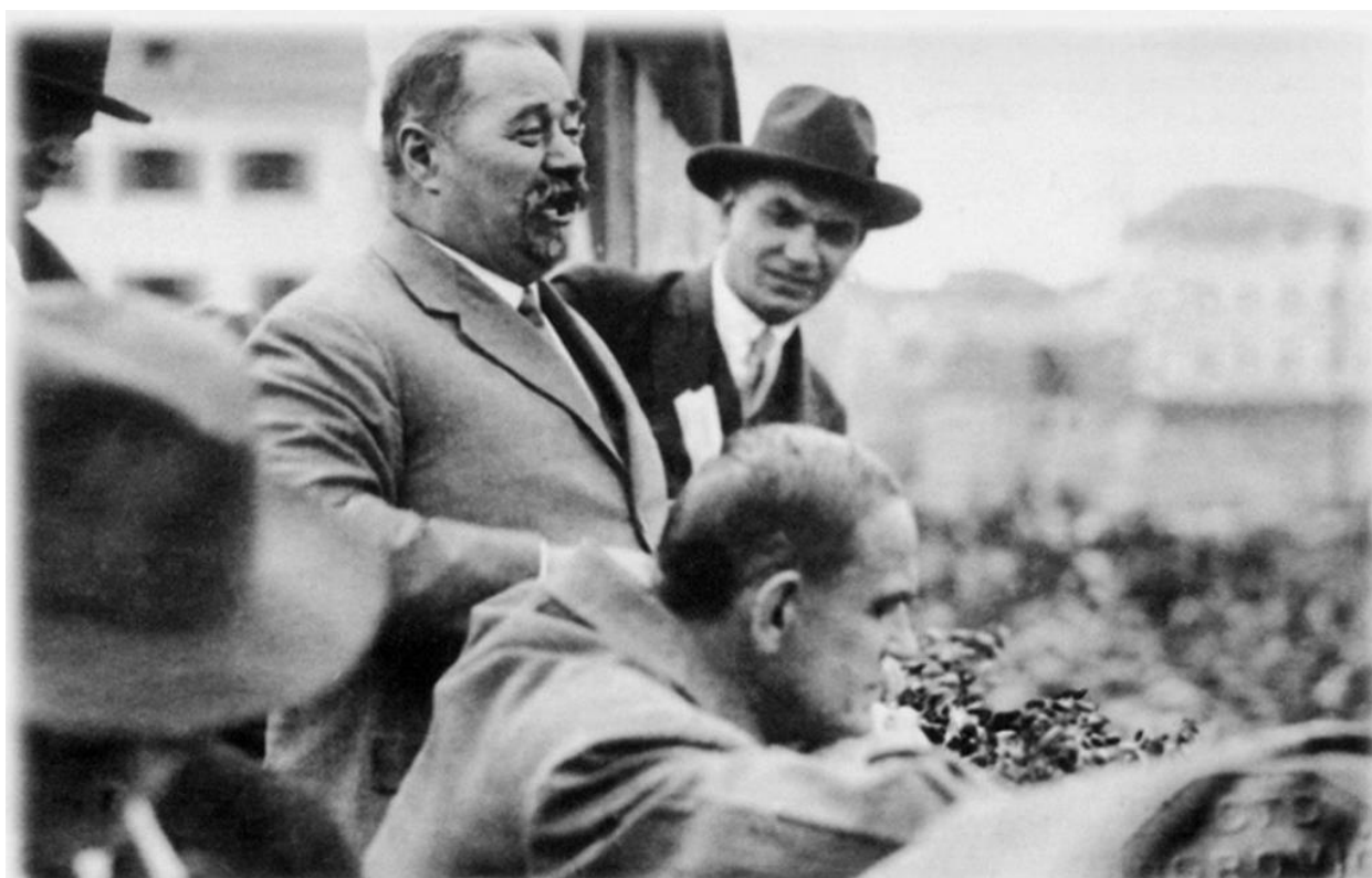
Slika 4. Stjepan Radić održava govor. 37

“Upozoravam, da se ljuto varate, ako mislite, da se ovako samovoljno može prijeći preko tisuću i više godina hrvatske povijesti i hrvatske državnosti. Mi Hrvati za to nismo. Naš hrvatski seljak – a to je devet desetina hrvatskoga naroda – u ratu postao je potpun čovjek, a to znači, da ne će više nikome služiti, nikome robovati, ni tuđinu ni bratu, ni tuđoj ni svojoj državi, nego hoće da se u veliko ovo doba ta država uredi na slobodnom republikanskom i na pravednom čovječanskom (socijalnom) temelju”, kazao je Radić. 36