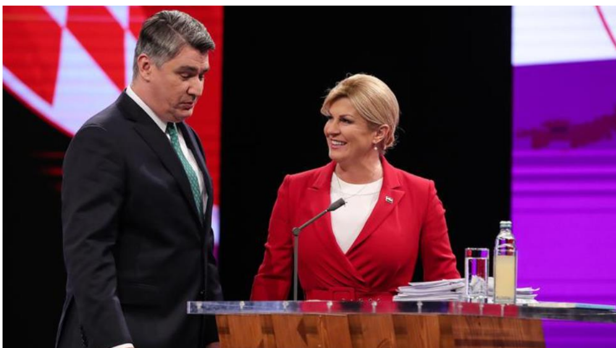
Slika 6. Vizualna komunikacija – kontakt očima. 43

Bivša predsjednica Grabar-Kitarović imala je odličnu vizualnu komunikaciju. Za vrijeme debata nikad nije skidala pogled sa protivnika, odnosno sadašnjeg predsjednika Zorana Milanovića.