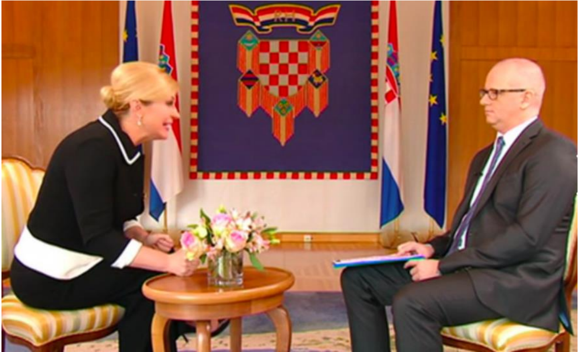
Slika 29. Grabar-Kitarović udarila šakom o stol. 77