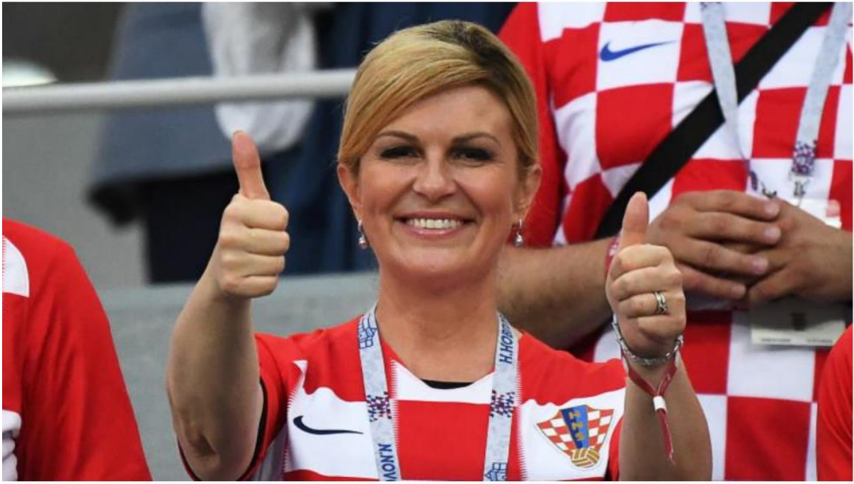
Slika 17. Sreća na licu Kolinde Grabar-Kitarović. 58

Naravno, kao i svaki prethodni spominjani odlomak koji je vezan uz Svjetsko nogometno prvenstvo u Rusiji 2018. godine, ovdje se vrlo jednostavno može pročitati kako je Kolinda Grabar-Kitarović sretna i nalazi se tamo kako bi im pružila podršku i slavila sa njima, što na kraju i jest. Fotografija je uslikana u trenutku kada je Kolinda Grabar-Kitarović podigla oba palca gore u znak podrške nogometašima. Samopouzdana, iskren osmijeh, te se na ovoj fotografiji ( Slika 17. ) vidi jedno prirodno izdanje neverbalne komunikacije Kolinde Grabar-Kitarović.