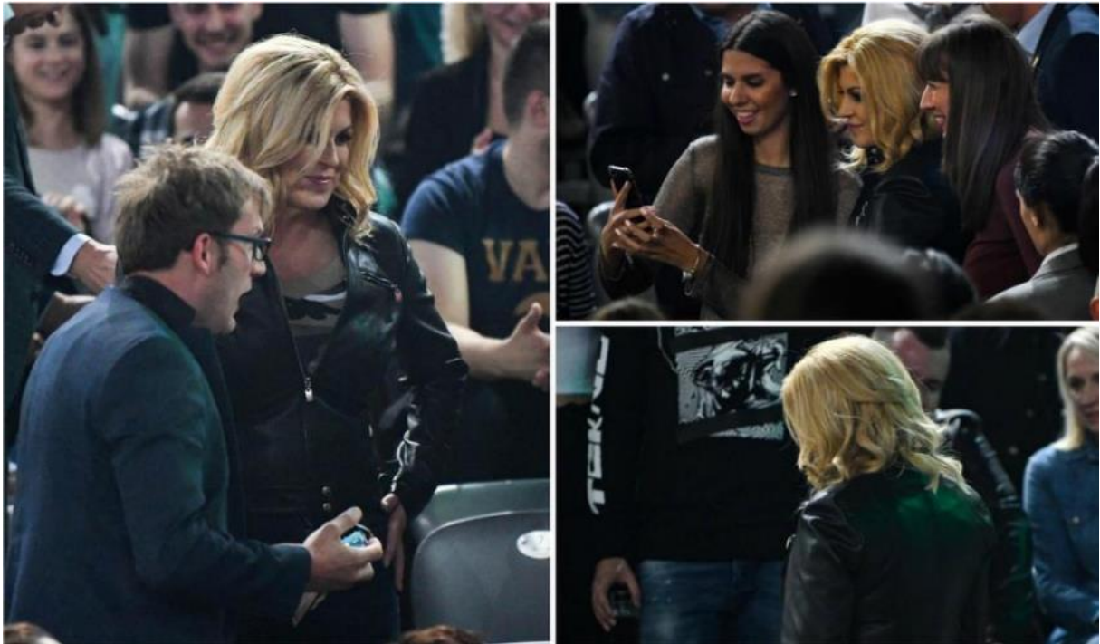
Slika 31. Kolinda Grabar-Kitarović na koncertu Prljavog Kazališta. 82

Jedno novije izdanje, mediji prenose iz veljače ove godine kako se je šetala Zagrebačkom špicom sa bivšom savjetnicom i psom Kikom. Svi mediji su pohvalili odjevnu kombinaciju, ali ponajviše kaput s cvjetnim detaljima. Sretna, nasmijana, ležerno neformalno izdanje zbog okoline u kojoj se nalazi u trenutku. 83