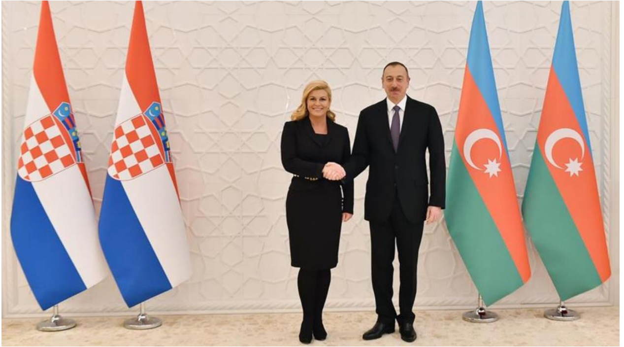
Slika 36. Grabar-Kitarović sa predsjednikom Azerbadžajna. 92