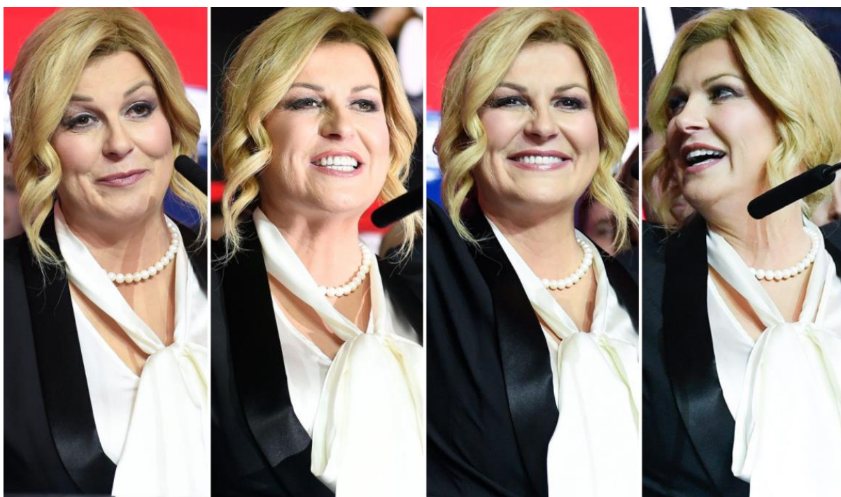
Slika 11. Vrtlog emocija na licu. 51

U emotivnom govoru mu je zaželjela uspjeh i svako dobro u obnašanju dužnosti, te je za kraj rekla »Ostanemo ujedinjeni, okupljeni za našu Hrvatsku.« 50