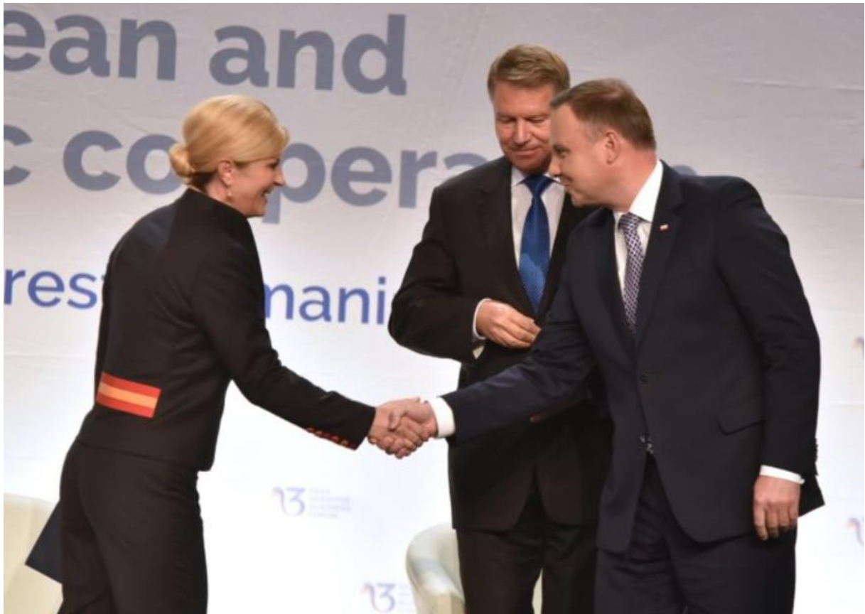
Slika 8. Kolinda Grabar-Kitarović i predsjednik Republike Poljske. 46

(Slika 8.) Prikazuje Kolindu Grabar – Kitarović kako srdačno, s osmijehom na licu pozdravlja predsjednika Republike Poljske Andrzeja Dudu. Na slici se vidi kako predsjednica iz poštovanja održava kontakt očima sa predsjednikom, te mu je uputila osmijeh.