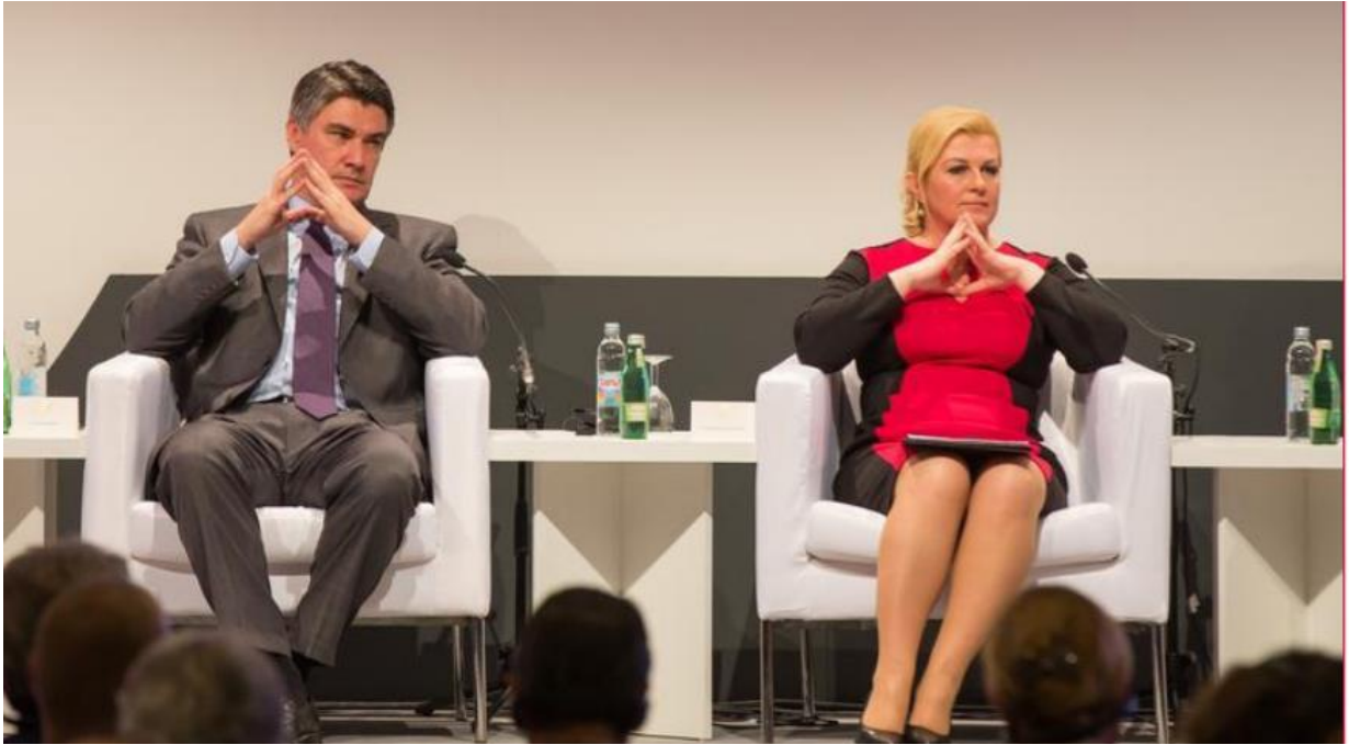
Slika 19. Gesta zrcaljenja kao znak povezivanja. 61

„Zrcaljenje je zapravo kopiranje nečijeg govora tijela. Zrcaljenjem se može iskazati interes za nekoga, ali i provjeriti pokazuje li netko interes za nas. Kada nam se netko sviđa, prirodno zrcalimo ili kopiramo neverbalnu komunikaciju te osobe, a tako pokazujemo i poštovanje. Ipak, nije poželjno zrcaliti sva ponašanja – zrcaljenjem negativnog govora tijela možemo još samo dodatno pogoršavaju atmosferu. Dobro izvedenim zrcaljenjem stvara se povezanost između dvaju sugovornika i ono je jako oružje neverbalne komunikacije. Ovu tehniku je najbolje koristiti samo za one dobre stvari, a ne loše.“ 62