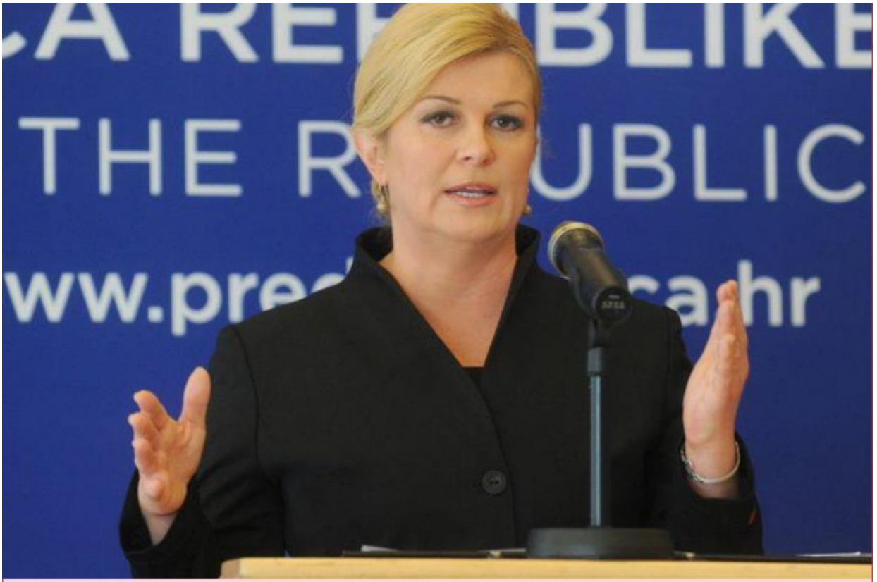
Slika 22. Kolinda Grabar-Kitarović održava govor. 65