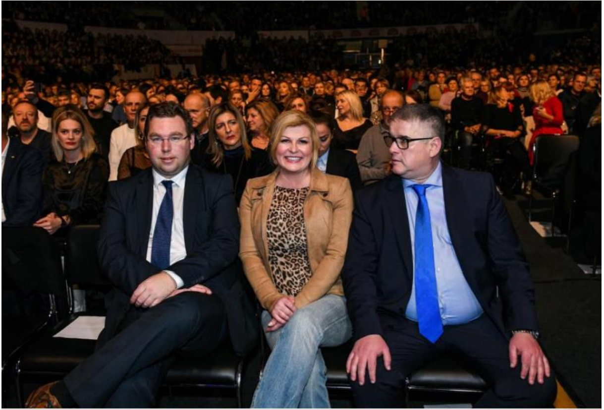
Slika 30. Ležerno izdanje Kolinde Grabar-Kitarović. 81

No, nije koncert klape Intrade bilo jedino ležerno izdanje bivše predsjednice. Svi se sjećamo koncerta Prljavaca i nešto tamnijeg izdanja Kolinde Grabar-Kitarović kada se je na koncertu pojavila u crnoj kožnoj jakni i tamnim trapericama. (Slika 31.) prikazuje kako se je Kolinda Grabar-Kitarović slikala sa mnogim fanovima koji su joj prilazili i ljudima koji su je htjela pozdraviti. Još jedan dokaz kako se je željela približiti hrvatskom narodu i pokazati im kako iako je na visokom položaju u državi, veoma lako ljudima doprijeti do nje.