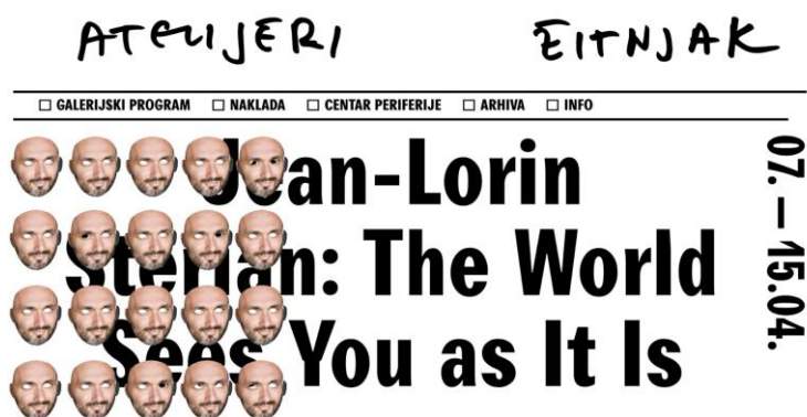
Slika 5. Primjer naslovna stranice, mrežnog sjedišta Atelieri Žitnjak.

Na temelju kratke analize konkurencije temeljene na petnaest galerija i muzeja fokusiranih tematski na modernu i suvremenu umjetnost u Hrvatskoj koja je provedena s ciljem prikaza u kojem postotku galerije i muzeji posjeduju mrežno sjedište, te koliko su te iste stranice funkcionalne u svojoj strukturi i dizajnu. Dobiveni rezultati pokazuju da gotovo sve odabrane galerije i muzeji posjeduju mrežno sjedište, iznimka su Galerija SC, pop-up Galerija Kamba, dok je web stranica Nacionalnog muzeja moderne umjetnosti zaražena virusom koji onemogućuje posjet stranici. Druga stavka je funkcionalnost postojećih web stranica pri čemu istraživanje pokazuje da velika većina ne zadovoljava osnovne kriterije, svega mali postotak je onih “dobrih” koji ispunjavaju određene kriterije, ali ipak ne sve. Prema tome kao primjere dobre prakse izdvaja se MSU te Atelieri Žitnjak, dok oni manje uspješni primjeri su Galerija 90-60-90 i Galerija Kranjčar.