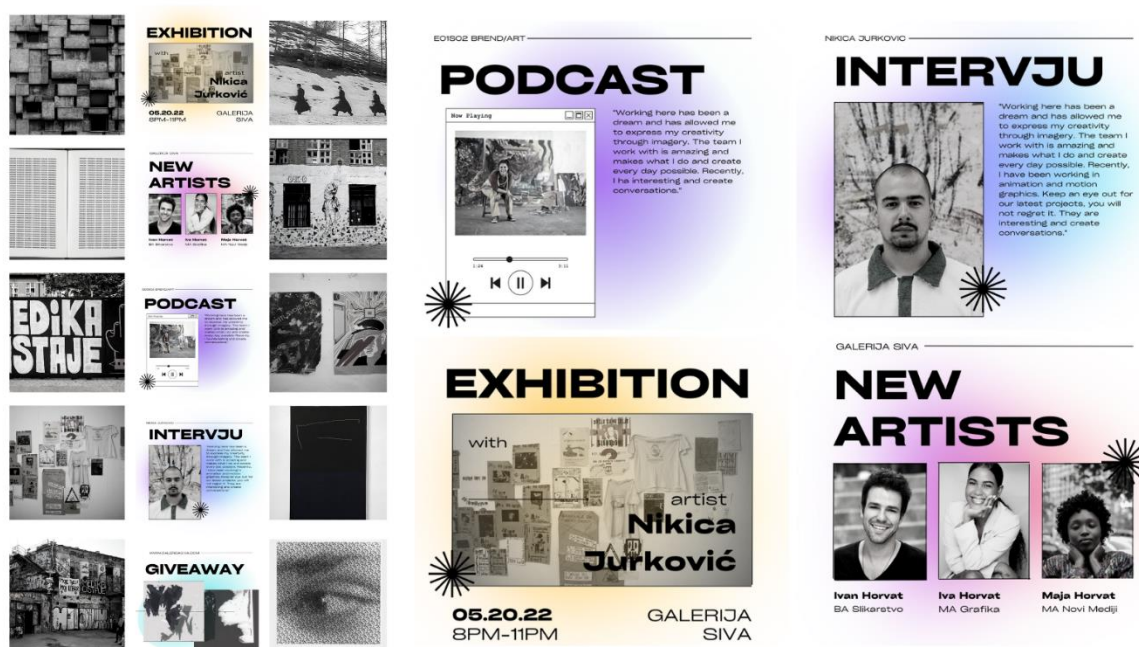
Slika 11. Primjer novog Instagram feeda (lijevo), primjer postova tj. Contenta na Instagram profilu Galerije Siva (desno).

strane: kolekcionara, tiska. Postoji mnoštvo ideja koliko i kakve objave bi se mogle kreirati, no najvažnije da odgovaraju vrijednostima, misiji, brandu galerije / muzeja te se zna što publika voli. Content creation Galerije Siva bazirao se na kombinaciji multimedijalnih sadržaja kao što su: podcast, intervju, tjedne izložbe i giveaway zajedno s tematski povezanim umjetničkim djelima koja pričaju priču.