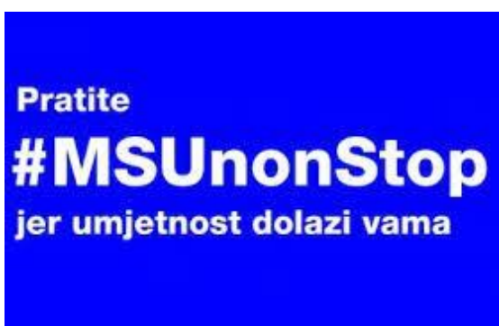
Slika 2. Primjer slikovnog oglasa iz kampanje sa glavnom porukom kampanje MSUonStop.

tehnologije je kampanja #MSUonStop, virtualni program nastao u suradnji s kinom Metropolis i mrežom MBU. Putem mreža Facebook, Instagram i Youtube predstavljene su izložbe iz povijesti muzeja, serija filmova nastalih u sklopu edukativnog programa Kluba mladih, virtualna igrica “Avantura Vita i Nade” namijenjena mladoj generaciji kako bi se na inovativan način upoznala s umjetničkim radovima Vjenceslava Richtera, ciklus „MSU priručnik za početnike“ u sklopu kojeg MSU na interaktivan način prikazuje i objašnjava pojmove iz vizualnih umjetnosti kako bi educirali i upoznali publiku s umjetničkim radovima iz vlastite arhive.