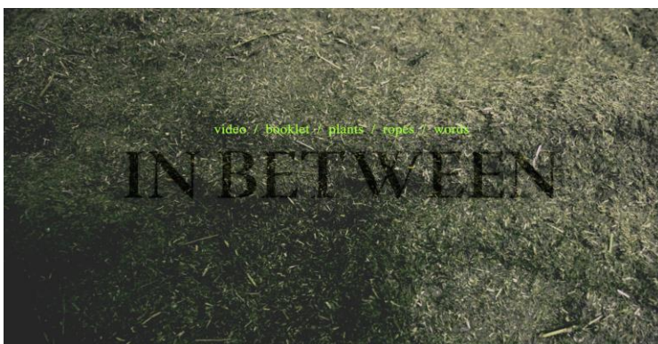
Slika 3. Naslovnica Virtualne Galerije,.