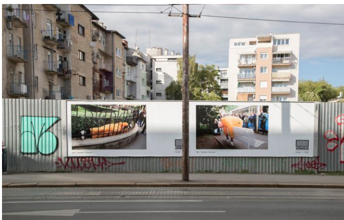
Slika 4. Umjetnički radovi iz kampanje Art&Grad na ulicama grada Zagreba.

Kuća za ljude i umjetnost Lauba, galerija koja se programski usmjerila na suvremenu umjetnost, služi kao jedan od primjera kako razmišljati, odnosno izlagati na suvremeni način. Projekt Art & Grad umjetnička je intervencija nastala suradnjom Turističke zajednice grada Zagreba i Laube. Riječ je o urbanoj akciji kojom se nastoji skrenuti pozornost na umjetnička djela kao prostor slobode, pretvarajući grad u veliku galeriju u kojoj svi građani čine ujedno i posjetitelje. Umjetnička djela zauzimaju oglasne površine jumbo plakata i CityLightove i nude publici direktan kontakt s više od 500 umjetničkih djela najznačajnijih umjetnika.