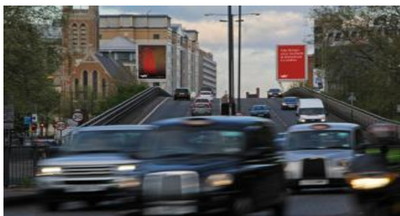
Slika 1. Vizuali kampanje Tate Galerije na glavnim prometnicama Londona.

Tate Modern se sastoji od četiri galerije: Tate Liverpool, Tate St Ives, te Tate Modern i Tate Britain u Londonu te je primjer jedne od najposjećenijih suvremenih umjetničkih institucija na svijetu koja uspješno promovira svoje usluge kroz različite načine. Jedan od takvih primjera jest digitalno oglašavanje na otvorenom koje daje priliku da se ožive umjetnička djela, a riječ je o kampanji “Welcome to London”. LIVEPOSTER™ i Tate Britain surađivali su na stvaranju kampanje koja je prikazivala relevantna umjetnička djela iz fundusa Tate Britain. “Drive through art” je kreativni koncept koji je koristio informacije o dobu dana, brzini prometa, vremenu letova i meteorološke podatke za odabir koja će umjetnička djela biti izložena vozačima na digitalnim panoima dok su se vozili u London na M4.