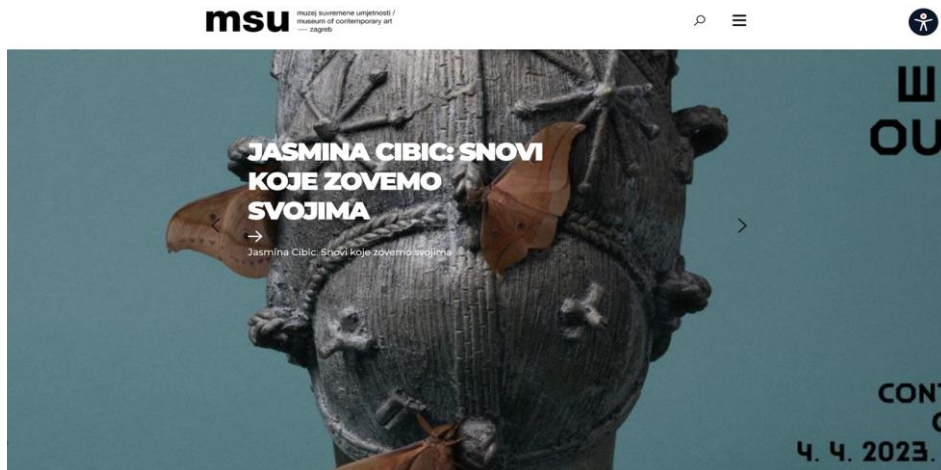
Slika 6. Primjer naslovne stranice, mrežnog sjedišta Muzej Suvremene umjetnosti, Izvor: http://www.msu.hr/en/ , pristupljeno 1.5.2023