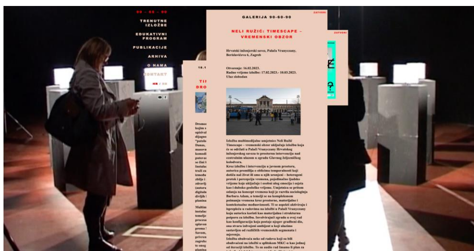
Slika 8. Primjer naslovne stranice, mrežnog sjedišta Galerije 90-60-90.