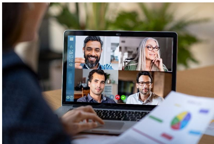
Slika 7. Neverbalna komunikacija u virtualnom okruženju. 46

Na osobnim susretima, širi stav tijela s blago razmaknutim stopalima i pravilno raspoređenom težinom može vam pomoći da izgledate samopouzdanije. Ovaj stav poboljšava disanje i glas, što pozitivno utječe na vaše samopouzdanje. U virtualnim okruženjima, vaše držanje tijela dok sjedite također igra važnu ulogu. Sjedite uspravno, s otvorenim ramenima i glavom usmjerenom prema ekranu kako biste prikazali samopouzdanje. Dobra položaj tijela ne samo da poboljšava vaš vizualni dojam, već i pozitivno utječe na vaše unutarnje samopouzdanje, što je ključno za učinkovitu komunikaciju u svim okruženjima.