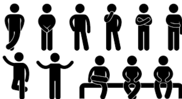
Slika 2. Ilustracija govora tijela. 15

komunikaciji, bilo društvenoj ili poslovnoj, i njegovo poznavanje može značajno poboljšati interakcije i odnose. 14