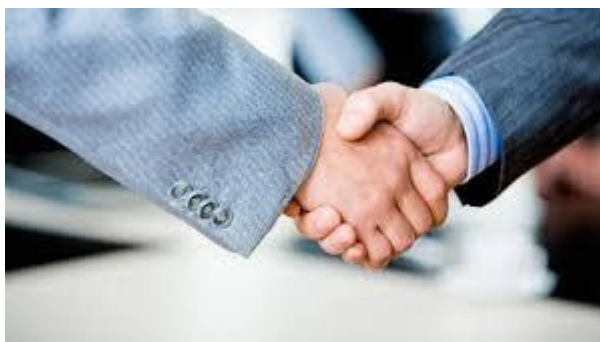
Slika 3. Rukovanje. 34

Dodir je ključan element neverbalne komunikacije koji može otkriti mnogo o našim osjećajima i osobnosti, iako ne uvijek na način koji izravno pokazuje naše unutarnje stanje. Različite vrste dodira, poput čvrstog rukovanja, toplog zagrljaja ili nježnog tapšanja, mogu prenijeti različite poruke, kao što su podrška, slaganje ili motivacija. Međutim, dodir može imati različite učinke na sugovornike, pa je važno biti pažljiv i razumjeti kontekst. Ako osoba ne uzvraća dodir, to može signalizirati nelagodu ili nesigurnost, dok uzvraćeni dodir obično ukazuje na prijateljsku otvorenost. Ključno je pratiti cijeli govor tijela i druge neverbalne znakove kako bi se ispravno interpretirao značenje dodira. 33