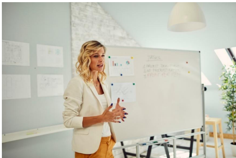
Slika 5. Uspješan javni nastup. 44

Kombinacijom pravilnog držanja, uravnotežene gestikulacije, kontakta očima i izraza lica, govornik može upravljati govorom tijela na način koji pojačava verbalnu poruku i ostavlja snažan, uvjerljiv dojam na pozornici.