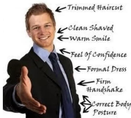
Slika 6. Važnost prvog dojma. 45

U fizičkim susretima, rukovanje je snažan neverbalni signal koji omogućuje brzu povezanost i može ostaviti trajan dojam. Rukovanje nas fizički povezuje i može stvoriti osjećaj povjerenja i otvorenosti. Ljudi imaju dvostruko veću vjerojatnost da će vas zapamtiti ako se rukujete s njima. U virtualnom svijetu, gdje fizički dodir nije moguć, osmijeh preuzima tu ulogu. Iskren osmijeh ne samo da poboljšava vaše emocionalno stanje, već šalje poruku da ste pristupačni i pouzdani.