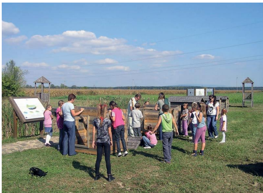
Slika 8. Edukativni programi za učenike.

posebno odnosi na školsku djecu i mladež, kao i na ostale posjetitelje. Primjeri edukativnih i izletničkih programa su: program „Krapje – selo graditeljske baštine“, program „Posavski konj“, program „Bijela roda u Čigoču“, program „Vodozemci u Lonjskom polju“, program „Ptica kosac – tajnoviti livadni pjevač“, program „U zagrljaju Lonjskog polja i trsnog gorja“ te program „Promatranje ptica u ornitološkom rezervatu Krapje Đol“ ( https://pp-lonjsko-polje.hr/wp-content/uploads/2020/01/Studija-upravljanja-posjetiteljima-za-Park-prirode-Lonjsko-polje-1.pdf / 14. 4. 2024.). Slika 8. prikazuje neke od aktivnosti edukativnih programa organiziranih za učenike.