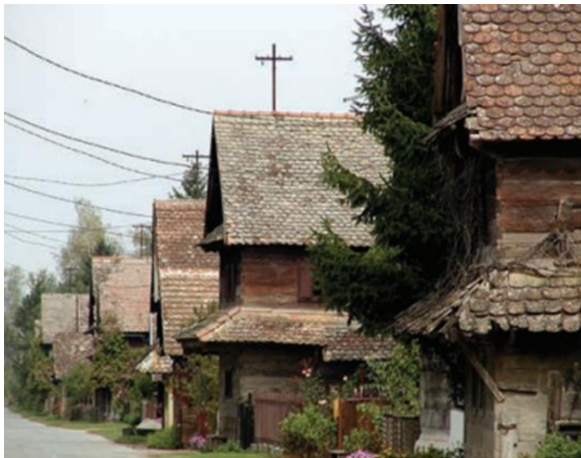
Slika 3. Selo Krapje – tradicijska arhitektura.

baštine koje je taj status dobilo zbog velikog broja kuća tradicijske drvene arhitekture. Na slici 3. vidi se primjer drvenih kuća odnosno tradicijske arhitekture u selu Krapje.