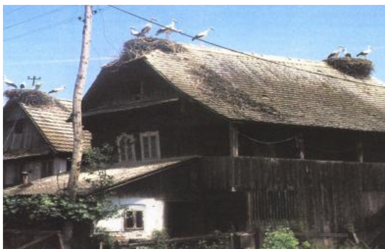
Slika 2. Rode u Čigoču.

( https://rsis.ramsar.org/RISapp/files/48561580/documents/HR584_lit191011_3.pdf/ 13. 3. 2024.). Slika 2. prikazuje gnijezda roda na kućama sela Čigoč.