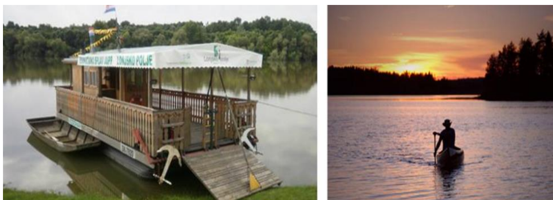
Slika 12. Dodatni sadržaji u PP Lonjsko polje.

/15. 4. 2024.). Međutim, kako je navedeno, sama kvaliteta više nije dostatna ponuda turističkog proizvoda. Na vrijednost proizvoda utječe temeljna kvaliteta proizvoda, zatim očekivana kvaliteta proizvoda, ali najviše utječe kvaliteta koja iznenadi. Potrebno je stoga stvarati turistički proizvod koji će proizvesti „kvalitetu iznenađenja“ odnosno stvoriti proizvod koji će nadmašiti očekivanja potrošača. Ponuda dodatnih sadržaja poput vožnje brodom rijekom Lonjom te mogućnost „kanu safarija“ kroz netaknutu prirodu vidi se i na slici 12.