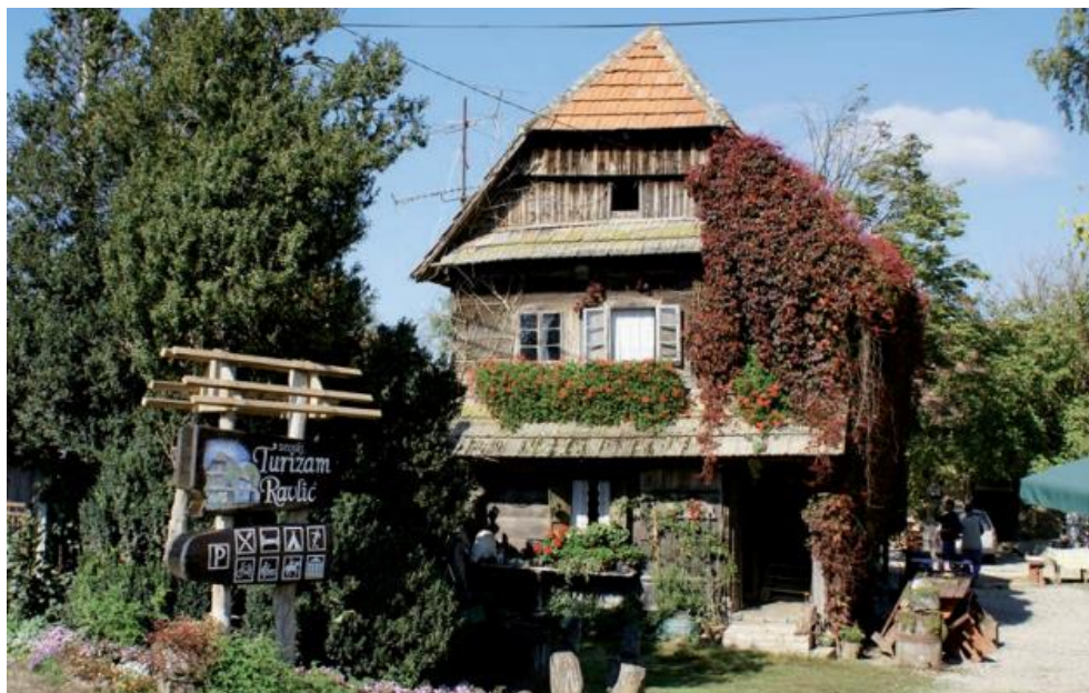
Slika 13. Primjer turističkog imanja obitelji Ravlič.