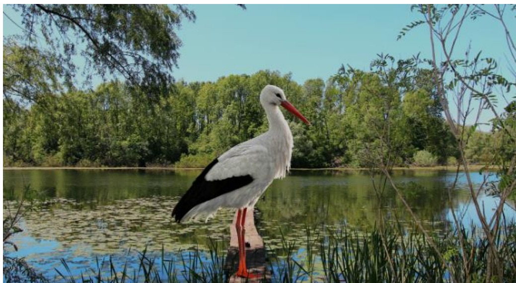
Slika 1. Roda u PP Lonjsko polje.

periodičnog godišnjeg poplavljanja, kada je jedan dio godine dobar dio područja pod vodom, stvaraju se preduvjeti za život raznih biljnih i životinjskih vrsta. Vrijednosti Parka i u međunarodnim okvirima čine njegova očuvana prirodna poplavna područja bogata florom i faunom specifičnom za ovaj kraj. Na slici 1. vidi se roda na prostoru Parka koja je karakteristična za ovaj krajolik.