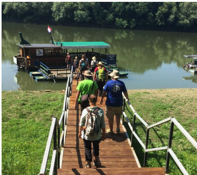
Slika 5. Pristanište u Drenovom Boku.

Turistička ponuda Lonjskog polja usko je povezana s njegovim fizičko-geografskim elementima koji čine ovu regiju posebnom i privlačnom za posjetitelje. Močvarna flora i fauna čini prirodne ljepote Lonjskog polja na kojima se bazira raznolika turistička ponuda poput promatranja ptica, fotografskih safarija, vožnja brodom rijekom Savom. Isto tako, područje je pogodno za neke oblike aktivnog odmora jer nudi mogućnost bicikliranja i pješaćenja po označenim stazama kroz polja, šume i uz rijeku. Slika 5. prikazuje pristanište u Drenovom Boku na rijeci Savi.