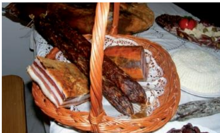
Slika 7. Proizvodi tradicijske svinjokolje.