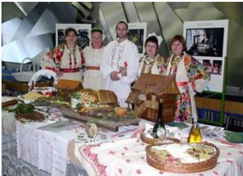
Slika 10. Narodna nošnja i kultura Lonjskog polja.

tradicionalna znanja izrade vezova. Bogatstvo narodnih nošnji koje su žene same izrađivale na tkalačkim stanovima, kao i bogatu gastro ponudu prikazuje i slika 10.