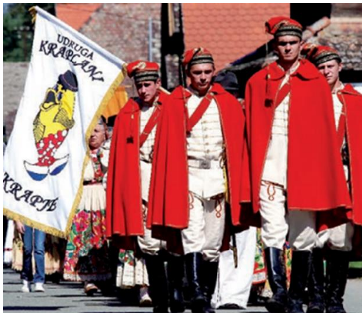
Slika 6. Povorka za Dan europske baštine u Krapju.

Posebnu tradiciju posjeta imaju vjerske i folklorne manifestacije kao što su folklorne svečanosti, seoski kirvaji, što je vidljivo na slici 6. koja prikazuje manifestaciju povodom Dana europske baštine u selu Krapje.