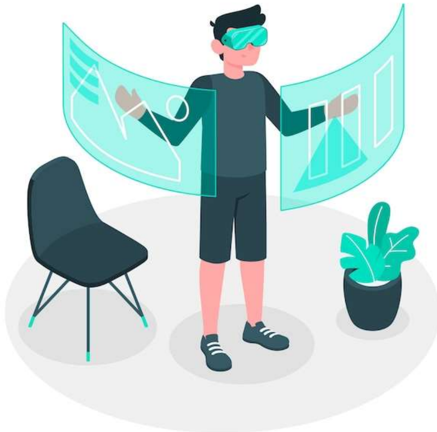
Slika 5 Proširena stvarnost, preuzeto s https://www.freepik.com/free-vector/virtual-reality-illustration-concept_6195508.htm#fromView=search&page=1&position=0&uuid=880a681a-e81f-49c2-8749-6ab61e54394e&query=augmented+reality

AR omogućuje interaktivno i zabavno iskustvo za korisnike, što povećava njihovu angažiranost i zadovoljstvo. Budući da AR omogućuje korisnicima da "isprobaju" ili vizualiziraju proizvode prije kupnje, smanjuje se vjerojatnost nezadovoljstva nakon kupnje i povrat proizvoda. AR pomaže korisnicima brže donošenje odluke o kupnji jer imaju priliku vizualizirati kako će proizvod izgledati u njihovom stvarnom životu, čime se povećava konverzija prodaje.