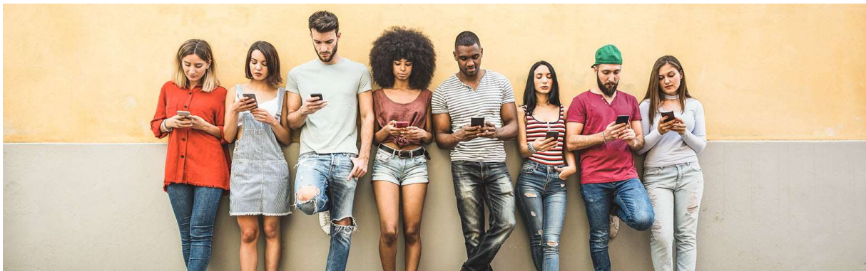
Slika 3 Generacija Z, preuzeto s https://www.google.com/url?sa=i&url=https%3A%2F%2Fwww.afflink.com%2Fblog%2Fhow-gen-zs-consumer-expectations-drive-new-supply-chain-trends&psig=AOvVaw2Gpg2b_DkPEhaV2ZwXyP-s&ust=1738156220441000&source=images&cd=vfe&opi=89978449&ve

Ova slika savršeno oslikava današnju generaciju Z, koja je odrasla uz pametne telefone, društvene mreže i neprekidnu povezanost s internetom. Karakterizira ih digitalna prisutnost, multitasking i stalna potreba za informacijama i interakcijom putem ekrana.