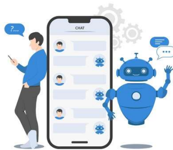
Slika 4 Chatbot

Chatbotovi omogućuju poduzećima pružati podršku 24/7, automatski odgovarajući na najčešća pitanja potrošača. Ovi alati mogu smanjiti pritisak na korisničke službe, dok istovremeno omogućuju brže odgovore kupcima.