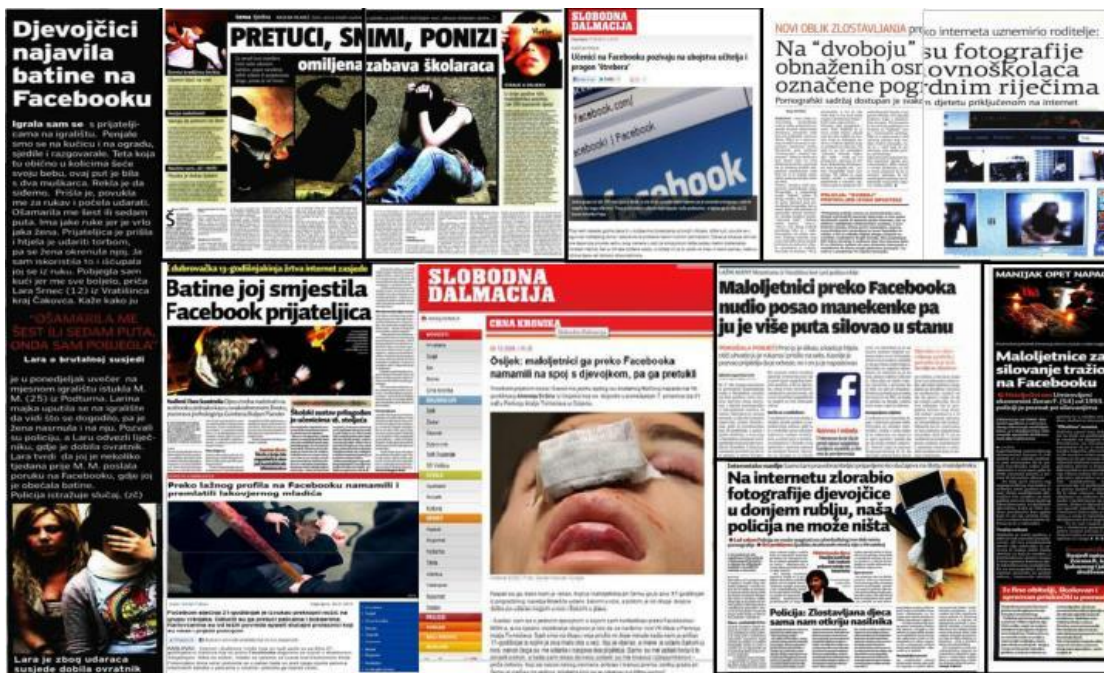
Grupe mržnje na društvenim mrežama - novi oblici nasilja među djecom i mladima