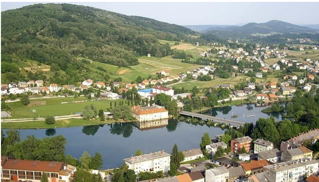
Slika 2: Šetalište Tušmer, Vinica u pozadini

istaknuti Egipat, Maltu i susjednu Mađarsku, koja, iako nema izlaz na more, uspijeva privući turiste tijekom cijele godine, većinom u Budimpeštu na ronjenje po rudnicima vapnenca i termalnim izvorima. Naravno, u Dugoj Resi nisu zaboravljeni ni tradicionalni sportovi, kao što su mali nogomet, odbojka na pijesku i tenis. Turističkoj destinaciji kao što je grad Duga Resa aktivni odmor, stvaranje napretka i poznavanje marketinga donose mnoge koristi. Kao najznačajnije koristi ističu se bolje razumijevanje potreba i želja turista, postizanje bolje konkurentske pozicije, kvalitetnija analiza konkurentnosti, bolja informiranost turista o ponudi destinacije, učinkovitija isporuka turističkih proizvoda destinacije potencijalnim potrošačima, učinkovitije upravljanje kvalitetom cjelokupne ponude i slično.