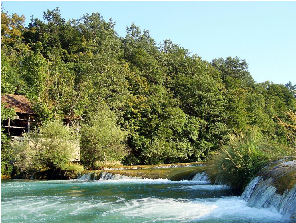
Slika 1: Slap Leskari

Najljepši slapovi nalaze se neposredno poslije izvora jer su zbog loše pristupačnosti sačuvani u svojem izvornom obliku. Slapovi su nejednoliko razmješteni, pa tako u razmaku od 5 kilometara na jednome dijelu možemo pronaći 26 slapova, a u donjem toku u razmaku od 39 kilometara nalazi se isto toliko slapova. Slap Šušnjar, koji se smjestio 3 km nizvodno od mosta u Tounjskom Tržišću, najviši je slap na rijeci i visok je 12,5 metara. Vrijedno je spomenuti i Gornji i Donji Čaćića slap, koji su dvostruki i trostruki slapovi, prosječne visine od dva metra. Rončevića slap predivni je slap u tri kaskade visine četiri metra, iza kojeg slijedi Milkovića slap, visine 8,5 metara. Korački slap sačinjava puno malih slapova koji se protežu u dužini od 10 kilometara. Na Rebićevom i Dobrenića slapovima mogu se vidjeti ostaci starih mlinova.