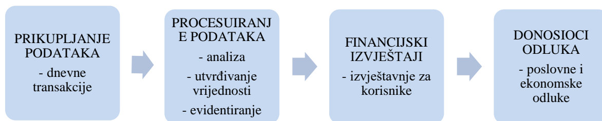
Slika 1: Tijek informacija u računovodstvenom sustavu

Financijska izvješća završni su cilj cjelokupnog računovodstvenog sustava. „Računovodstveni sustav, kao najznačajniji dio informacijskog sustava poduzeća, može se opisati kao proces prikupljanja financijskih podataka, njihova procesiranja, tj. obrade i sastavljanja računovodstvenih informacija“ 1 . Rezultat toga je nastanak financijskih izvještaja, a njihov cilj je informiranje zainteresiranih korisnika o financijskom položaju poduzeća i uspješnosti poslovanja.