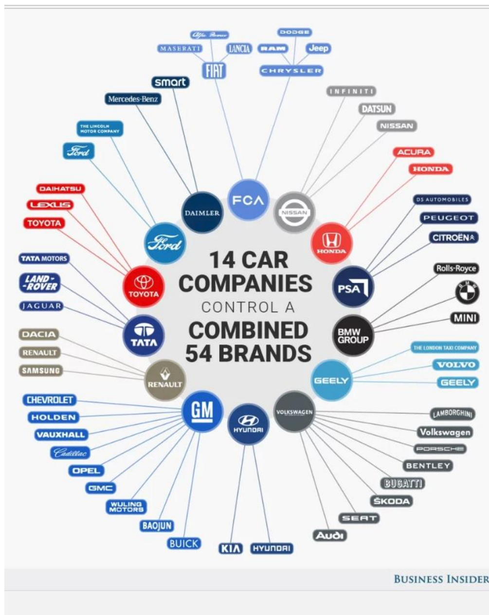
Slika 1. Prikaz najvećih automobilskih kompanija