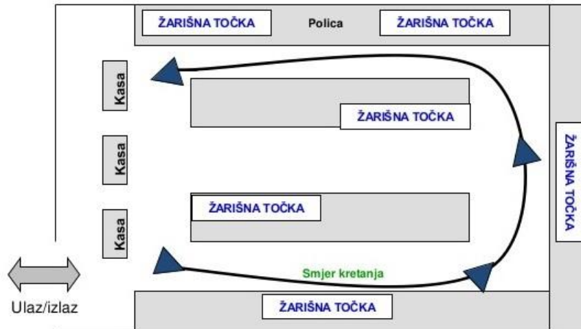
Slika 1. Smjer kretanja u objektu

Kreiranje potražnje na mjestu prodaje prema utvrđenim pravilima merchandisinga danas su zapravo standardi u merchandising procesu. Na temelju komparativne analize kompanija koje su usvojile, razvile i implementirale merchandising kao strategiju, može se zaključiti kako se instrumenti merchandisinga kojima se upravlja zbog upravljanja potražnjom na mjestu prodaje grupiraju i promatraju kroz prizmu zalihe, pozicija i prezentacija i vezanih standarda merchandisinga. Proizvod na maloprodajnom mjestu mora biti pravilno postavljen, uočljiv i dostupan najvećem dijelu potrošača. Proizvodi moraju biti kao što je prikazano na slici 1. izloženi u pravcu kretanja potrošača i na mjestima njegovog zadržavanja.