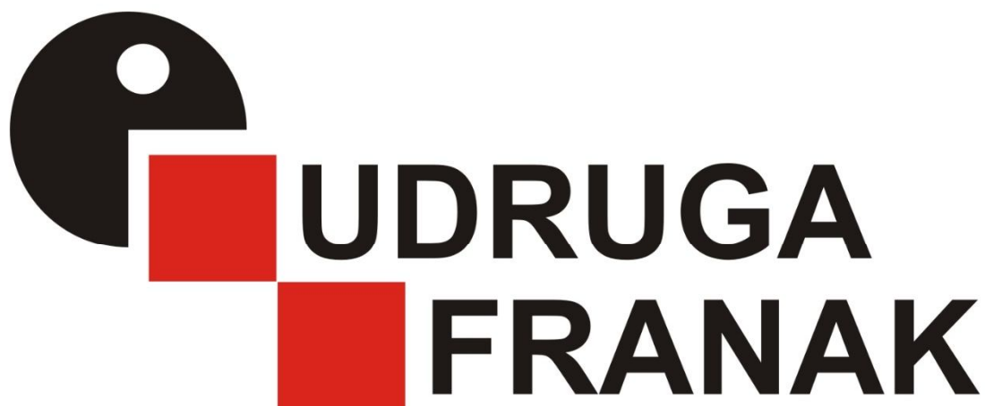
Slika 4.: Znak Udruge Franak