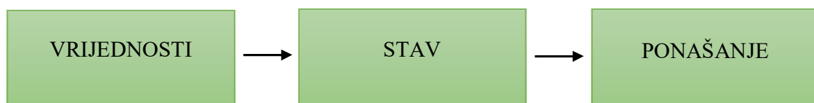
Slika 1.: Odnos između vrijednosti, stavova i ponašanja

U filozofskom smislu riječi, vrijednosti su subjektivne ili objektivne kvalitete bića ili bitka. 3 Vrijednosti u etici imaju normativni karakter što znači da podrazumijevaju određenu strukturu. Vrijednosti predstavljaju najdublje razloge koje imaju ljudi da bi postupali onako kako postupaju. 4 Slika 1. donosi prikaz odnosa između vrijednosti, stava i u konačnici samog ponašanja.