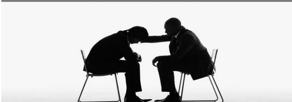
Slika 4. „Komunikacija sa šefom“ 69

Osim vještine slušanja iznimno je važna i neverbalna komunikacija, vještine prezentacije i pregovaranja. „Način na koji se nešto kaže važniji je od onoga što se kaže“. 70