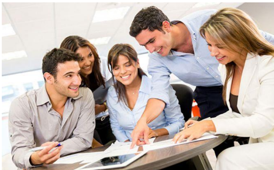
Slika 6. „, Empatija i poslovni uspjeh“ 81

A upravo empatija je ta koja nam u velikoj mjeri ovo omogućuje.