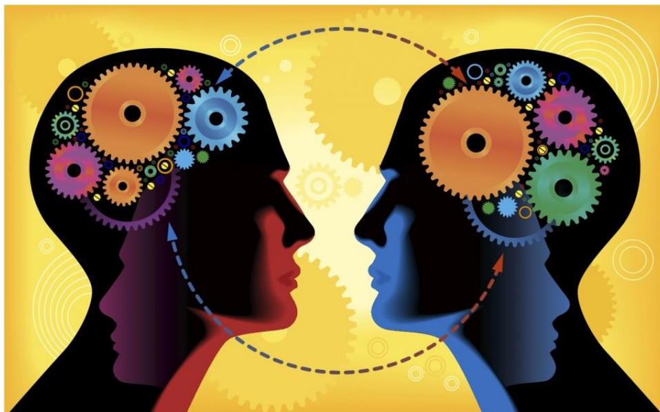
Slika 2. Razumijevanje tuđih emocija. 30

Kada govorimo o empatiji postoje dvije vrste empatije, a to su emocionalna empatija i kognitivna empatija. „Emocionalna empatija nam pomaže uspostaviti emocionalnu povezanost s drugom osobom, osjećajući emociju kod druge osobe, na primjer osjećanje tuge ili stresa zbog emocije druge osobe te da suosjećamo s njom. Kognitivna empatija se odnosi na razumijevanje tuđih emocija i razmišljanja, odnosno razumijevanje pitanja ili briga koje se nalaze u pozadini nečijih osjećaja. Ona nam pomaže boljoj komunikaciji jer možemo na bolji način iznijeti vlastite misli pretpostavljajući kako će druga strana reagirati.“ 29