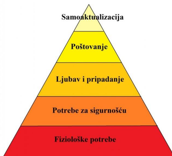
Slika 3. „Maslowljeva piramida.“ 54

drugima. S obzirom na to da su neke tvrtke prepoznale pravi značaj zadovoljnog radnika za tvrtku, iste razvijaju i alate za bolje shvaćanje njihovih potreba.“ 53 Prema Maslowljevoj „Piramidi potreba“ jedna od temeljnih čovjekovih potreba je potreba za pripadanjem i poštovanjem, zato je važno da čovjek osjeti povezanost s organizacijom u kojoj radi kako bi u njoj mogao zadovoljiti upravo ove potrebe za pripadanjem i poštovanjem.