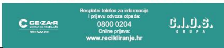
Slika 5: otkup auto olupina - oglas