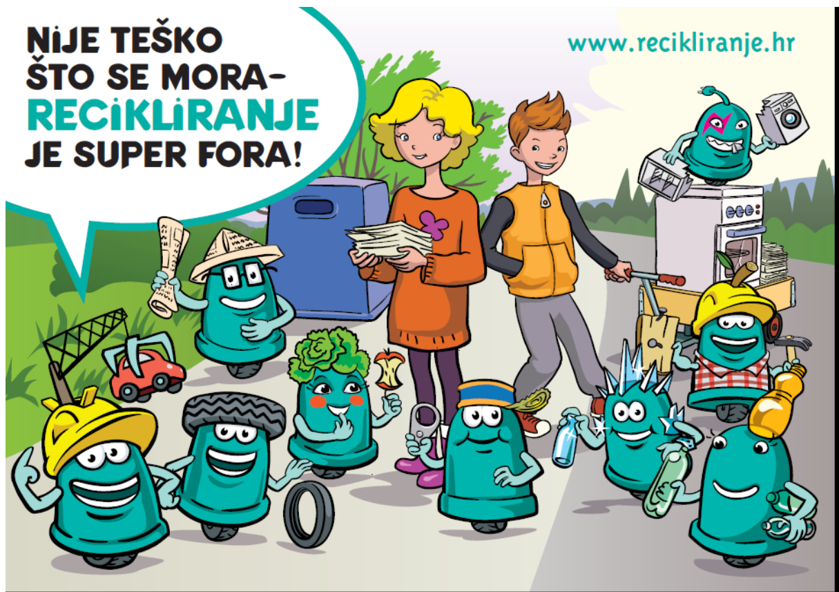
Slika 3: recikliranje – edukacijski plakat, izvor: dokumentacija CIOS Grupe

Primjer za to su materijali namjenjeni školskoj djeci, nastavnicima i roditeljima unutar kampanje pod naslovom: NIJE TEŠKO ŠTO SE MORA, RECIKLIRANJE JE SUPER FORA .