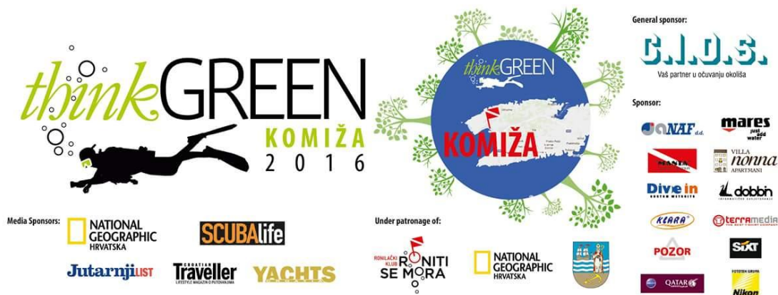
Slika 1: DOP akcija Komiža, izvori: dokumentacija CIOS Grupe

Konceptom DOP-a poslovni subjekt trudi se preuzeti na sebe dio tih nefinancijskih utjecaja poduzeća koji na kraju predstavljaju trošak ili gubitak za društvo. Problem DOP-a jest to što su raspon i intenzitet pokazatelja te razina njihove primjene dobrovoljni i time proizvoljni, što različitim organizacijama također dopušta da se za različite razine aktivnosti i primjene tih pokazatelja nazivaju društveno odgovornima. Tako se često događa da se pojam zloupotrebljava te se poduzeća nazivaju društveno odgovornima zbog aktivnosti koje su ionako u njihovoj odgovornosti jer su propisane zakonom ili aktivnosti koje su same po sebi očekivane ili je utjecaj tih aktivnosti beznačajan. Osim toga, problem primjene DOP-a velikim je dijelom i u nerazumijevanju pojma. DOP je odgovornost poduzeća za sve svoje utjecaje na sve dionike kao i ulaganje u prakse i aktivnosti koje nadilaze zakone.