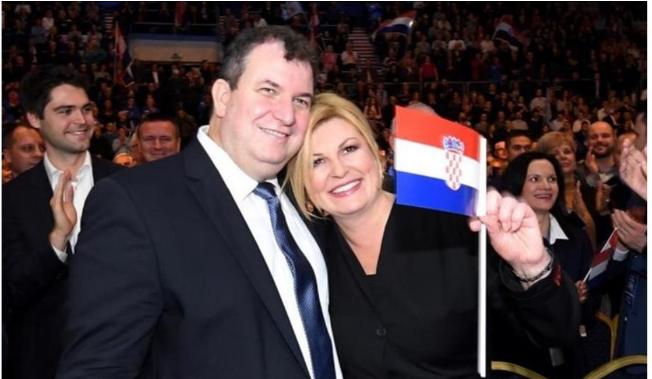
Slika 20. Intimna zona bivše predsjednice uz supruga Jakova. 63

Prostorne zone možemo podijeliti na: intimne, društvene i javne zone. Intimna je naravno ona najosobnija, jer u nju ulaze samo bliske osobe uz koje se osjećamo ugodno. Slika 20. pokazuje intimnu zonu između supružnika Kitarović koji su sretni u zagrljaju. Svi ostali koji nisu na tzv. listi intimne zone koji ulaze u takvu zonu osobi kojoj prilaze stvaraju nelagodu.