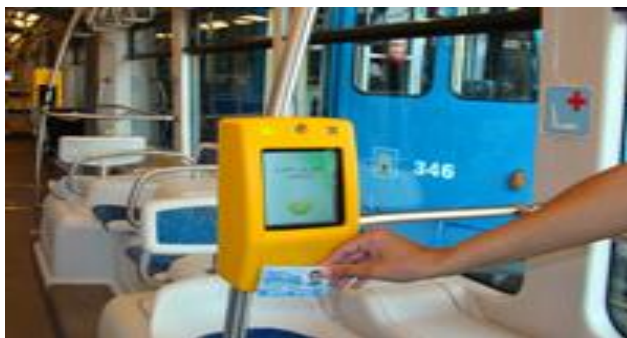
Slika br.6 ; Sustav naplate pretplatnom karticom