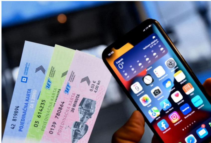
Slika br.8 : Mobilna karta