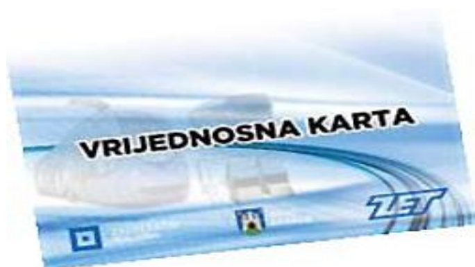
Slika br.7 : Izgled vrijednosne karte