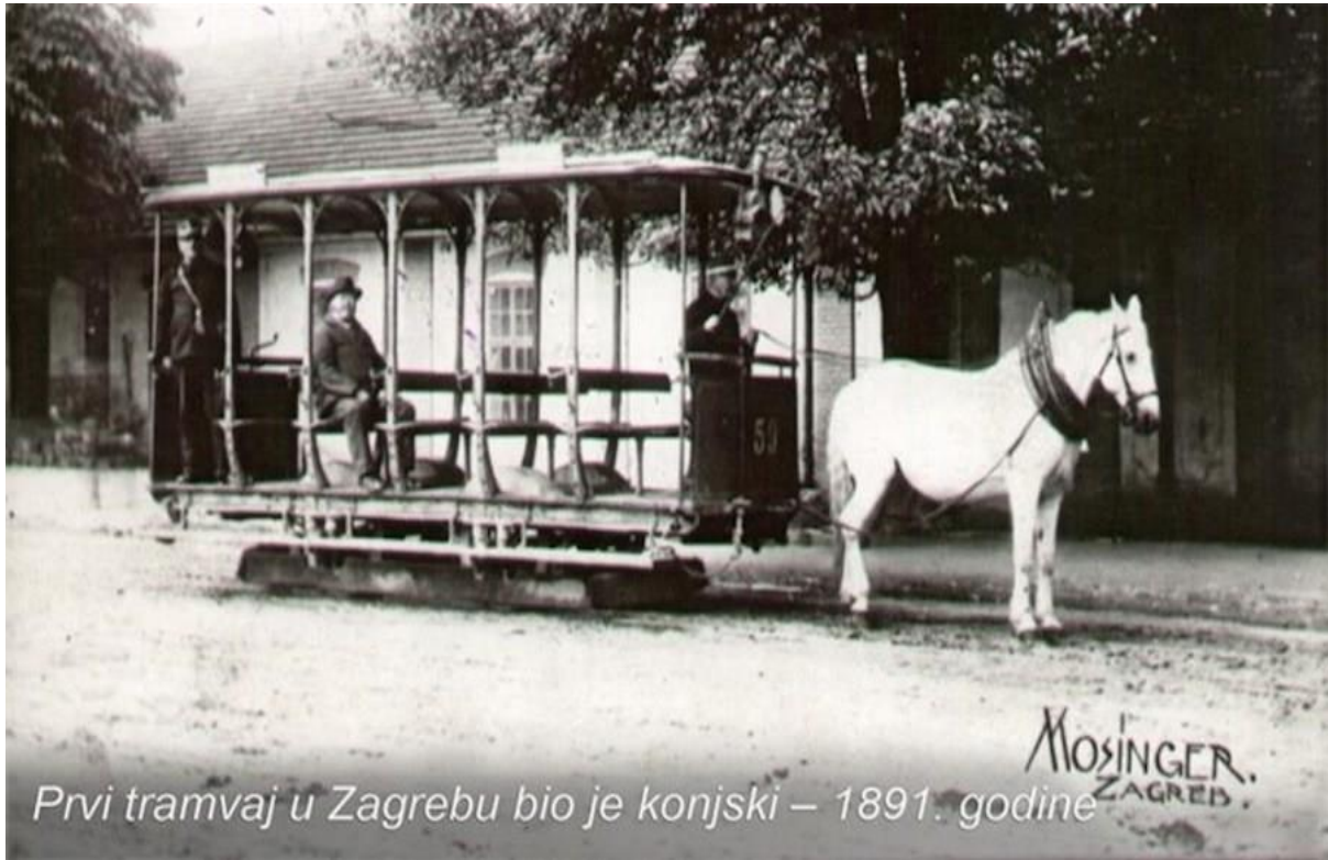
Slika br.1 : Prvi tramvaj i Zagrebu