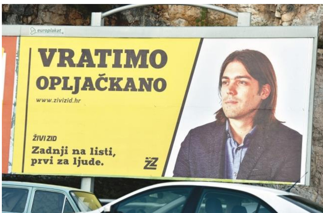
Predizborni plakat Živog zida sa čelnikom stranke 16

Dio biračkog tijela koji do sada nije bio aktivan isprovocirala je mlađa generacija koja je svojim nastupima i naravno obećanjima ulila novu nadu da se ipak promjene mogu dogoditi i kada se čini da nema izlaza. No, i oni su izgleda pod utjecajem stare političke škole koja je na političkoj pozornici od 90-ih godina na ovamo na čelu sa strankom Živi zid, koristeći nove metode komunikacije među mladima, društvene mreže tj. Facebook, organizirali prosvjede i na prosvjedima koristili retoriku kojom su pobudili interes da se možda ipak nešto može promijeniti jer samo treba izaći na izbore, a ne ostati kod kuće. Kao i bezbroj puta ranije, ponovila se ista priča 15 .